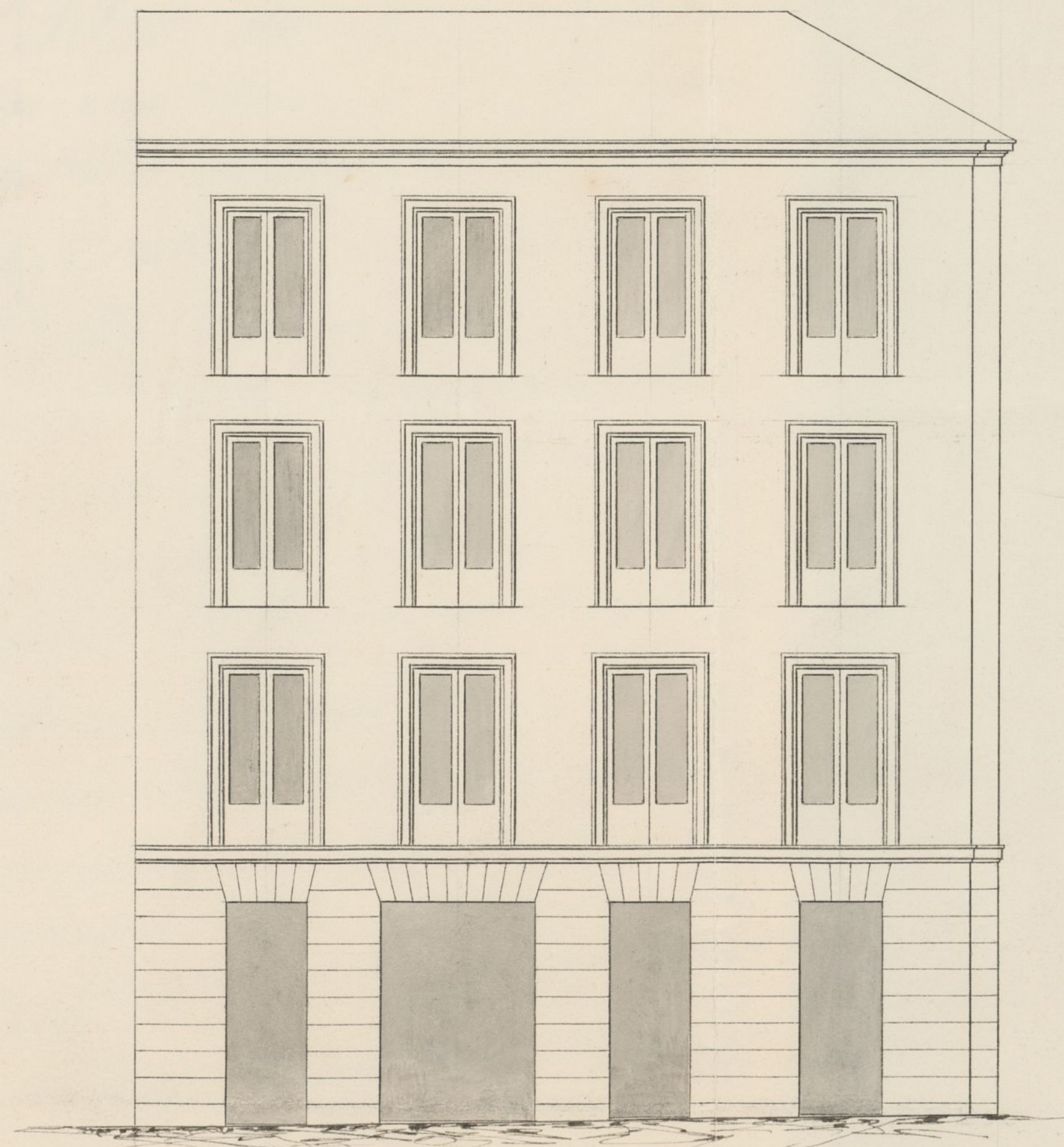
Fachada á la Calle del Baño.