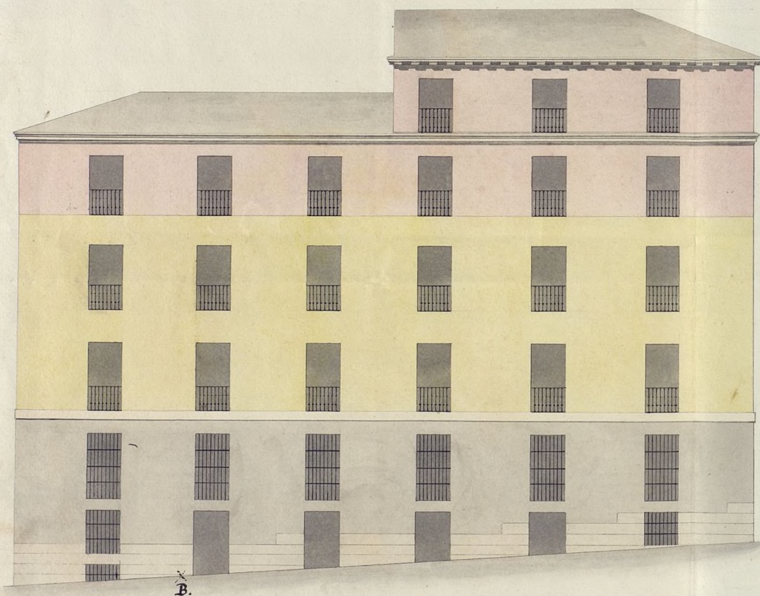
Fachada de la Casa n.º 2 calle de Gabel la catolica