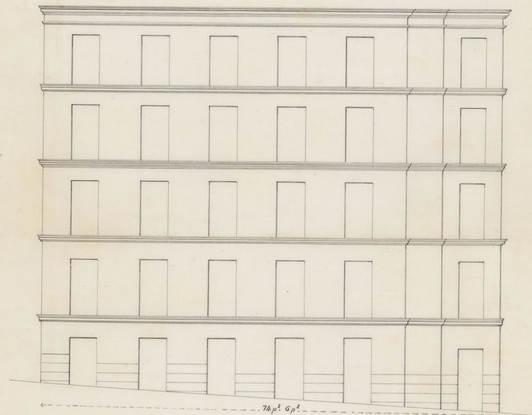
Calle de Juan de Dios N° 2.