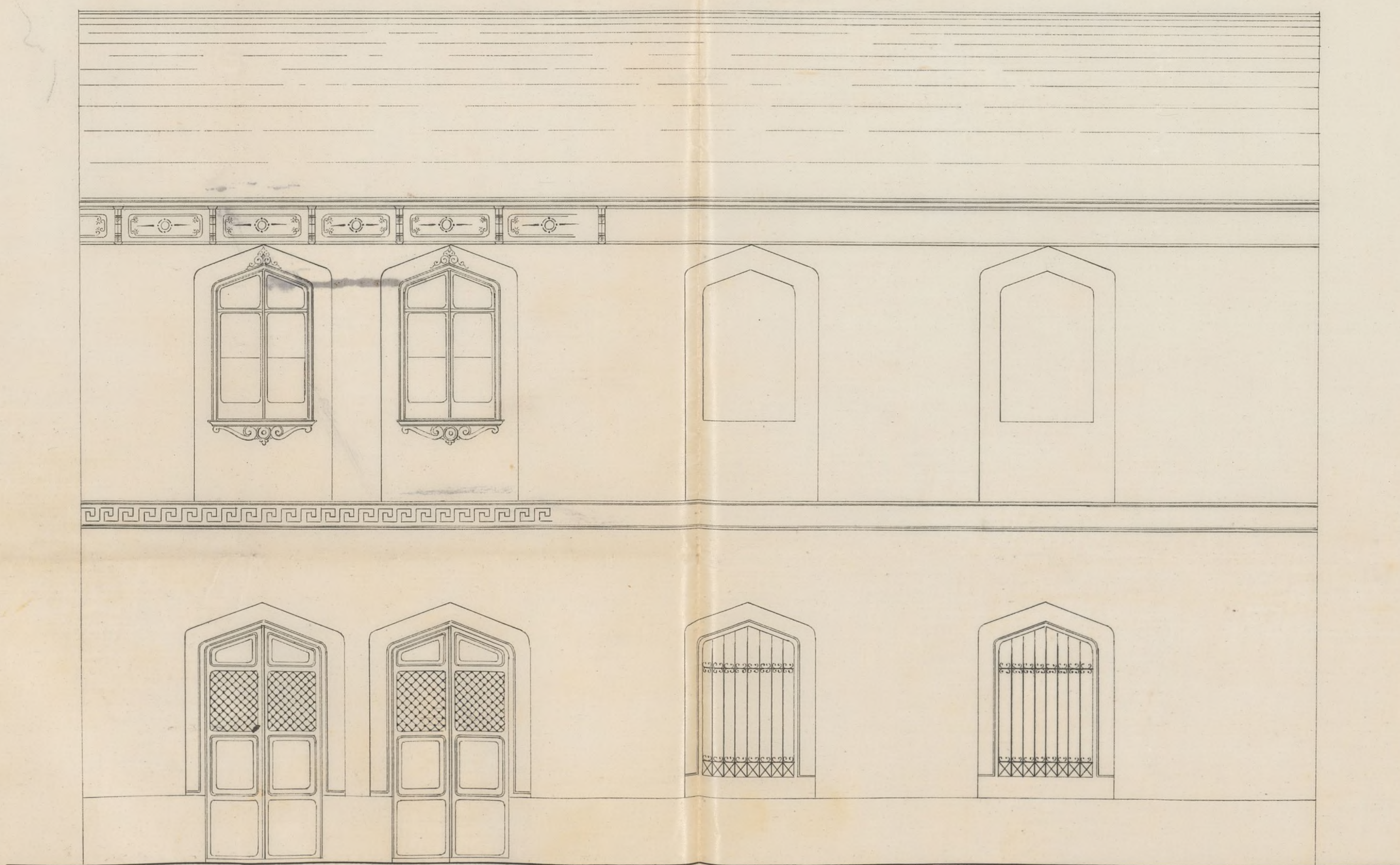
Fachada del nuevo proyecto.

Escala de 10. 2. 3. 4. 5. 6. 7. 8. 9. metros. Escala de 10. 2. 3. 4. 5. 6. 7. 8. 9. pies.