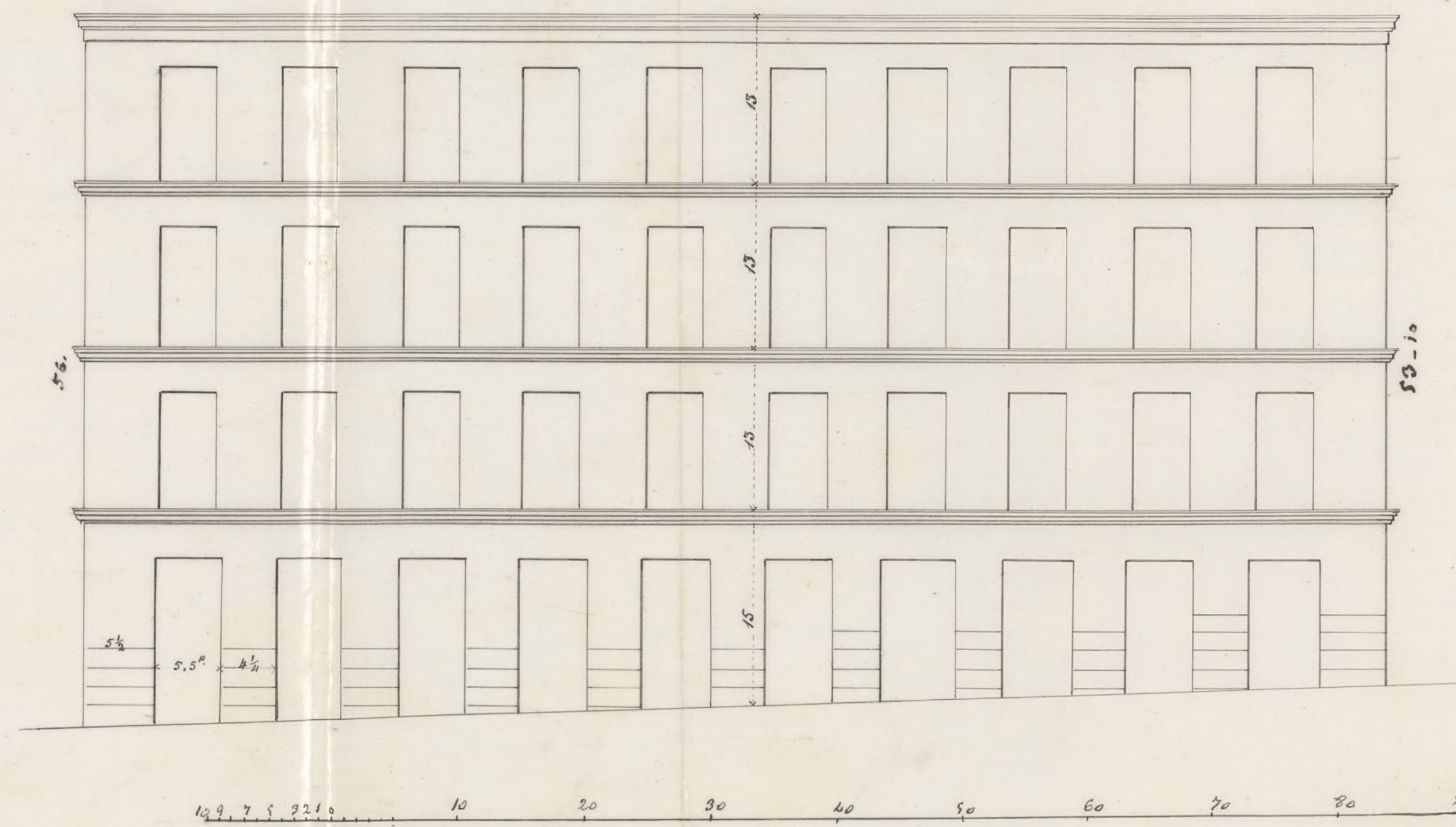
Calle de S. Vicente N° 28 y 30.