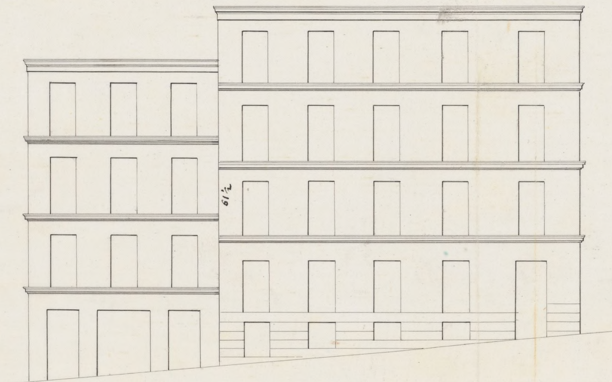
Calle del Dos de Mayo N° 2