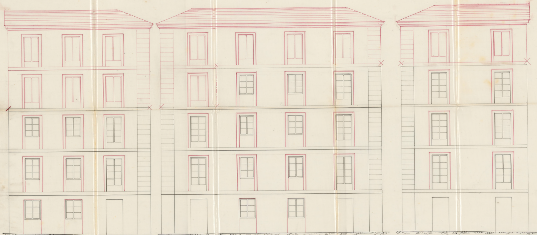
C a de Triados n.º 50