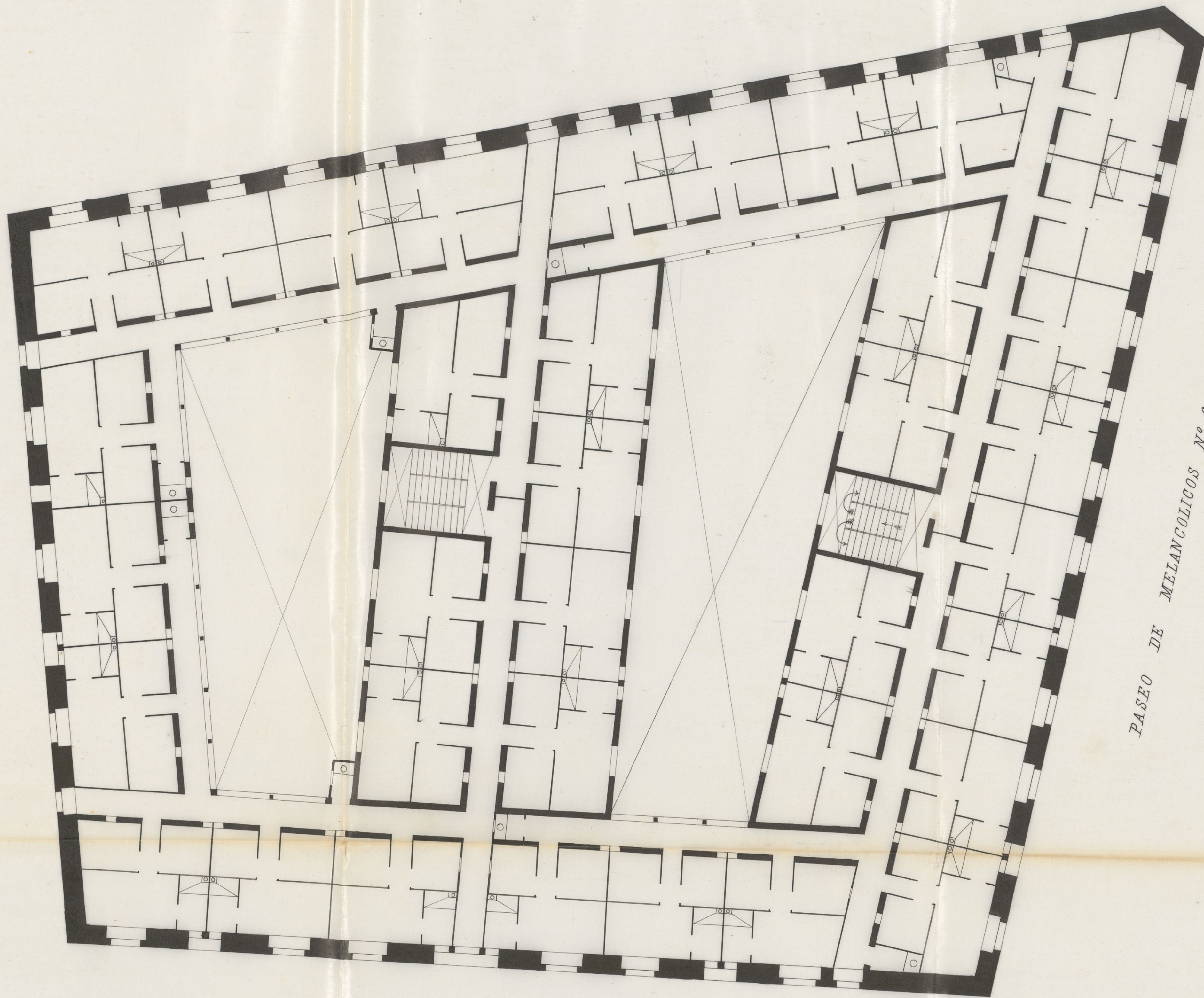
PASEO DE MELANCOLICOS N.º 6.