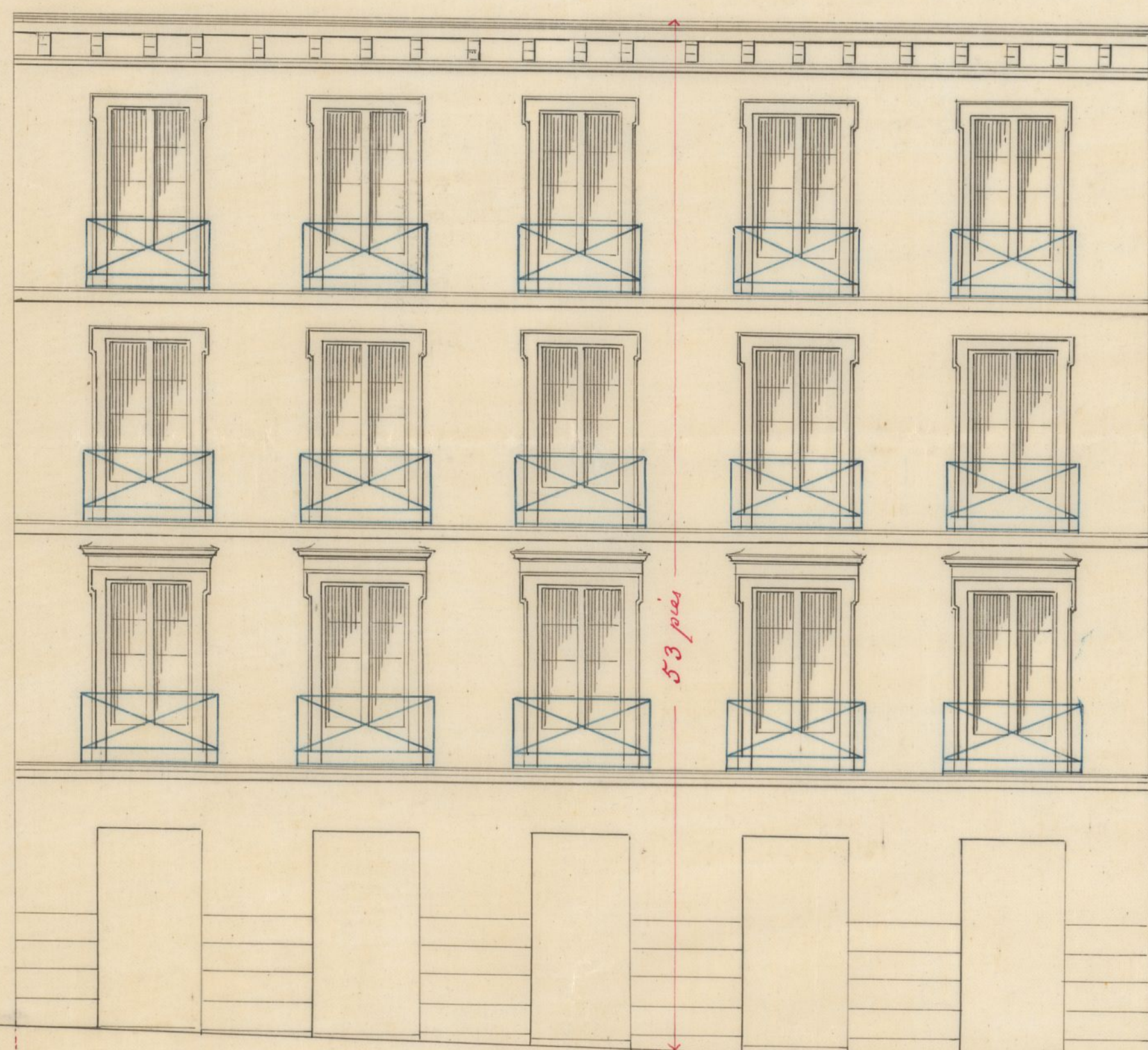
58 pies 9 pulg. Calle del Espíritu Santo.

Planos de las fachadas de la casa que trata construir de nueva planta D. José Pimentel _____ en un solar de su pertenencia en esta Corte, sito en la Calle del Espíritu Santo n.º 23 y 25 modernos, 5 y 6 antiguas con accesorios à la del Tesoro n.º 6 y 8 moderno en la manzana 473.