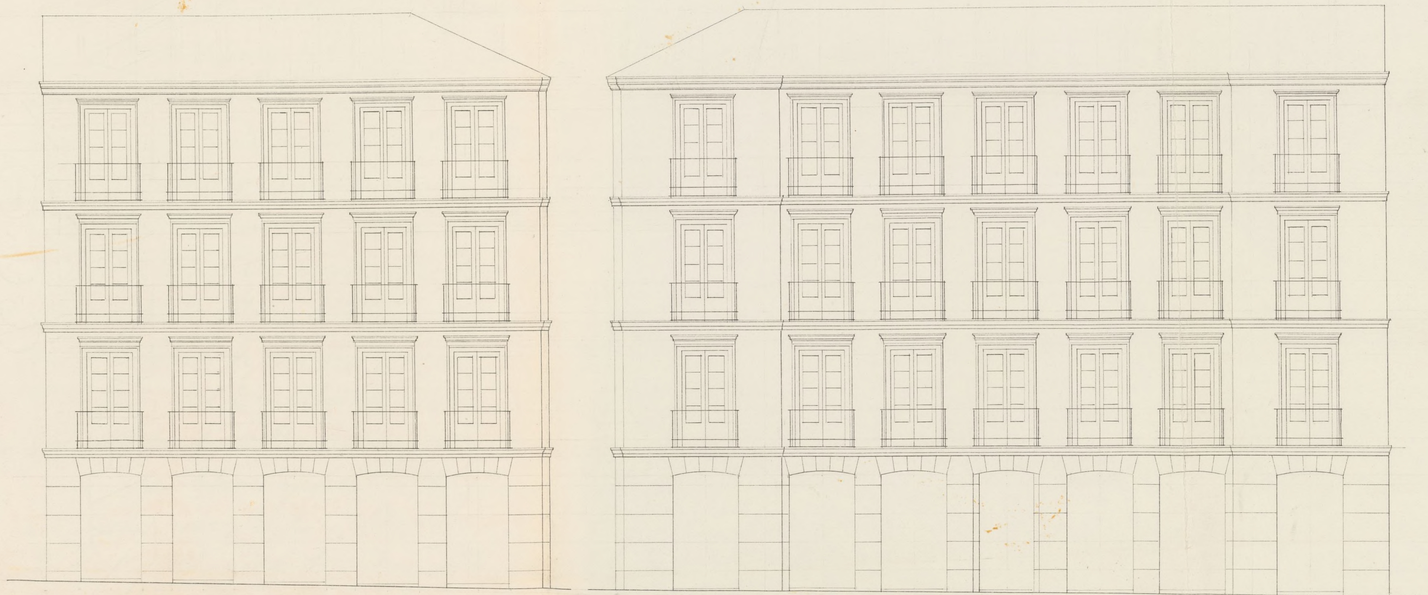
Fachada de la calle Cruz del Espiritusanto n. o 1 moderno.

Escala de 10. 20. 30. 40. 50. 60. 70. 80. Pica castellana