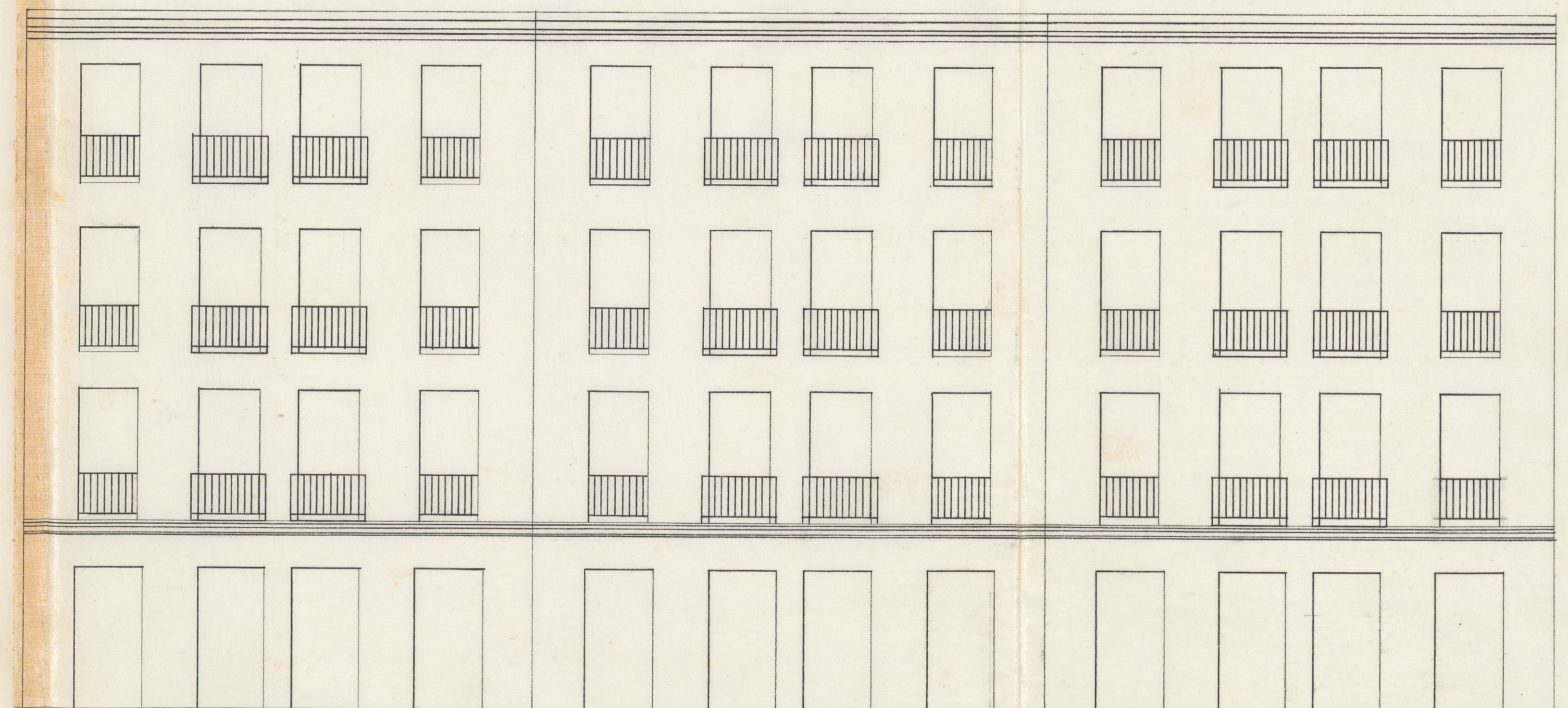
CALLE DE LA FLORIDA N° 14.

Madrid 15 de Abril de 1864 El Arquitecto.