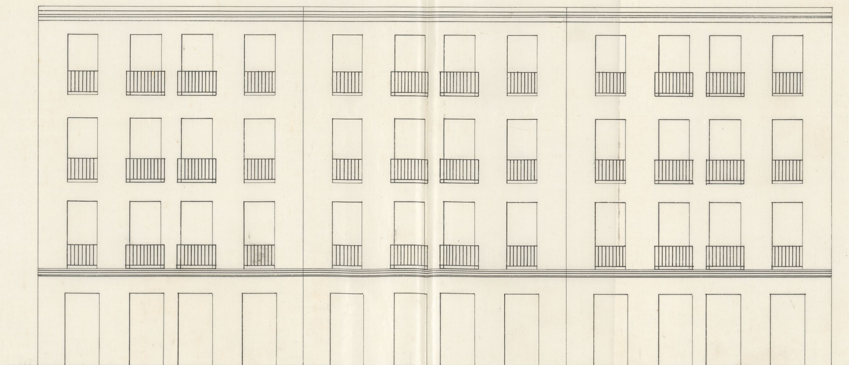
CALLE DE S. OPROPIO N° 7.