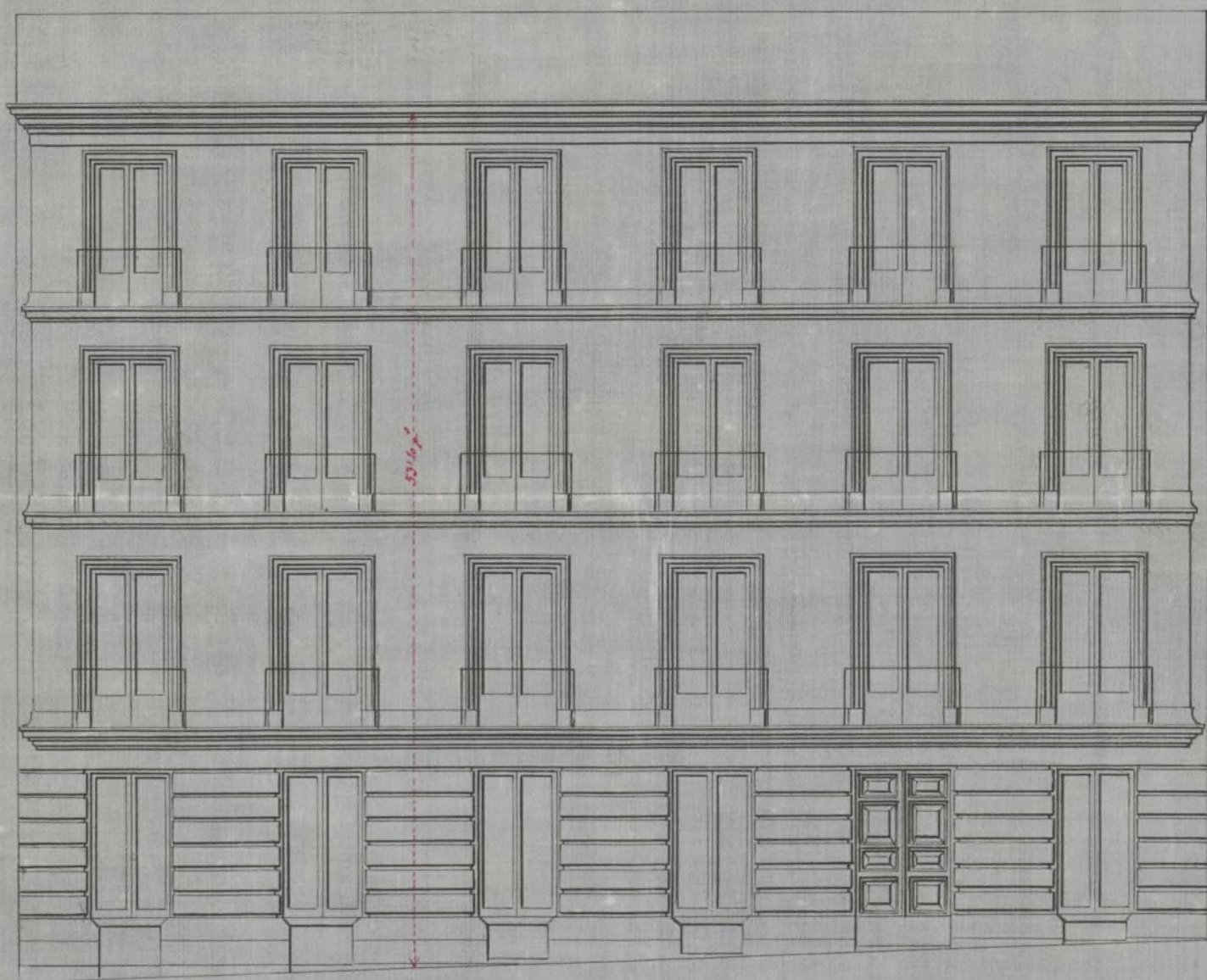
Fachada calle de las Hileras número 4 moderno.