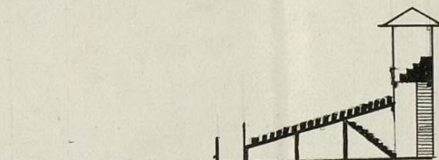
Corte Por la Línea, 1, 2.