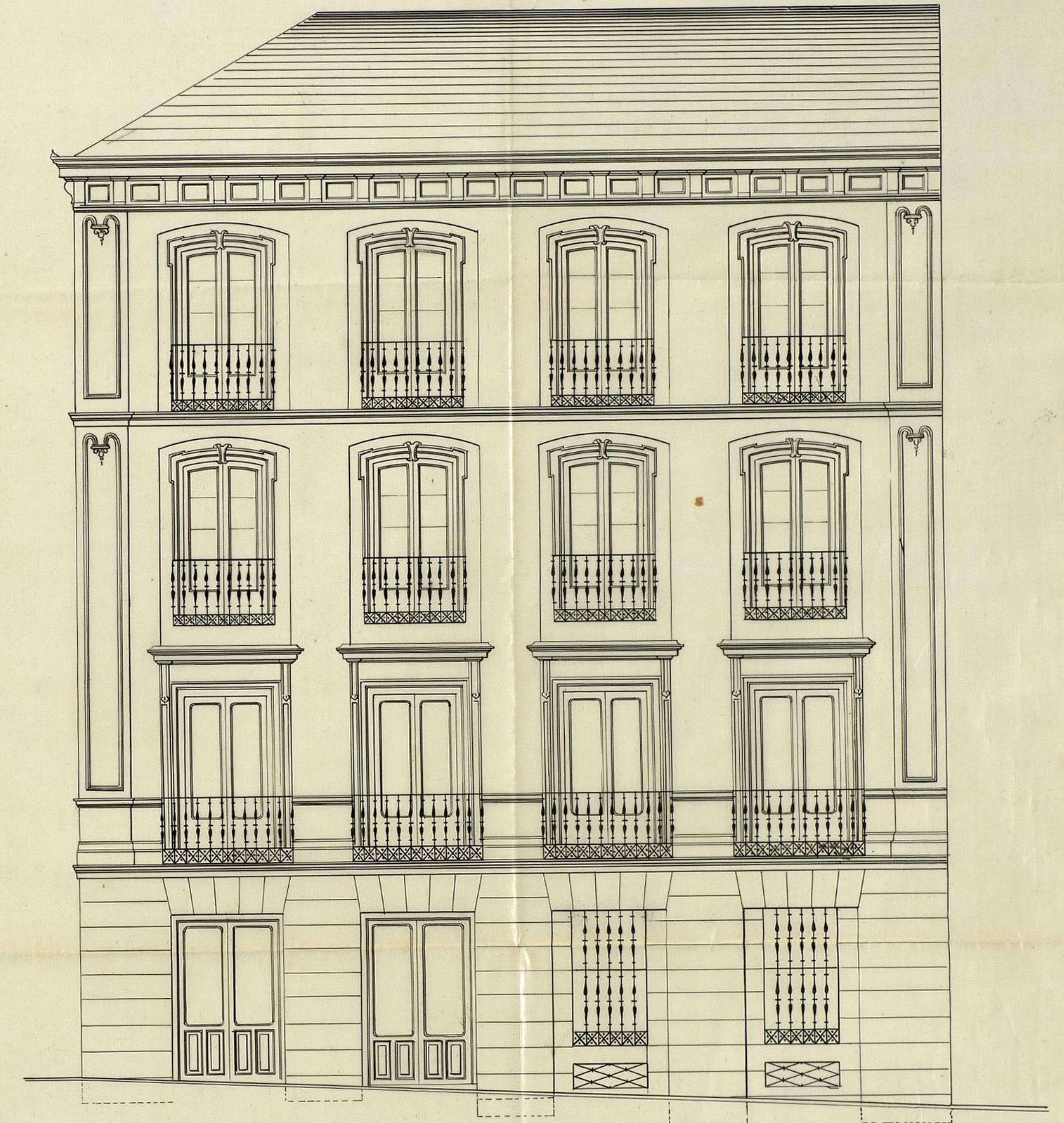
Calle de la Reina n.º 23