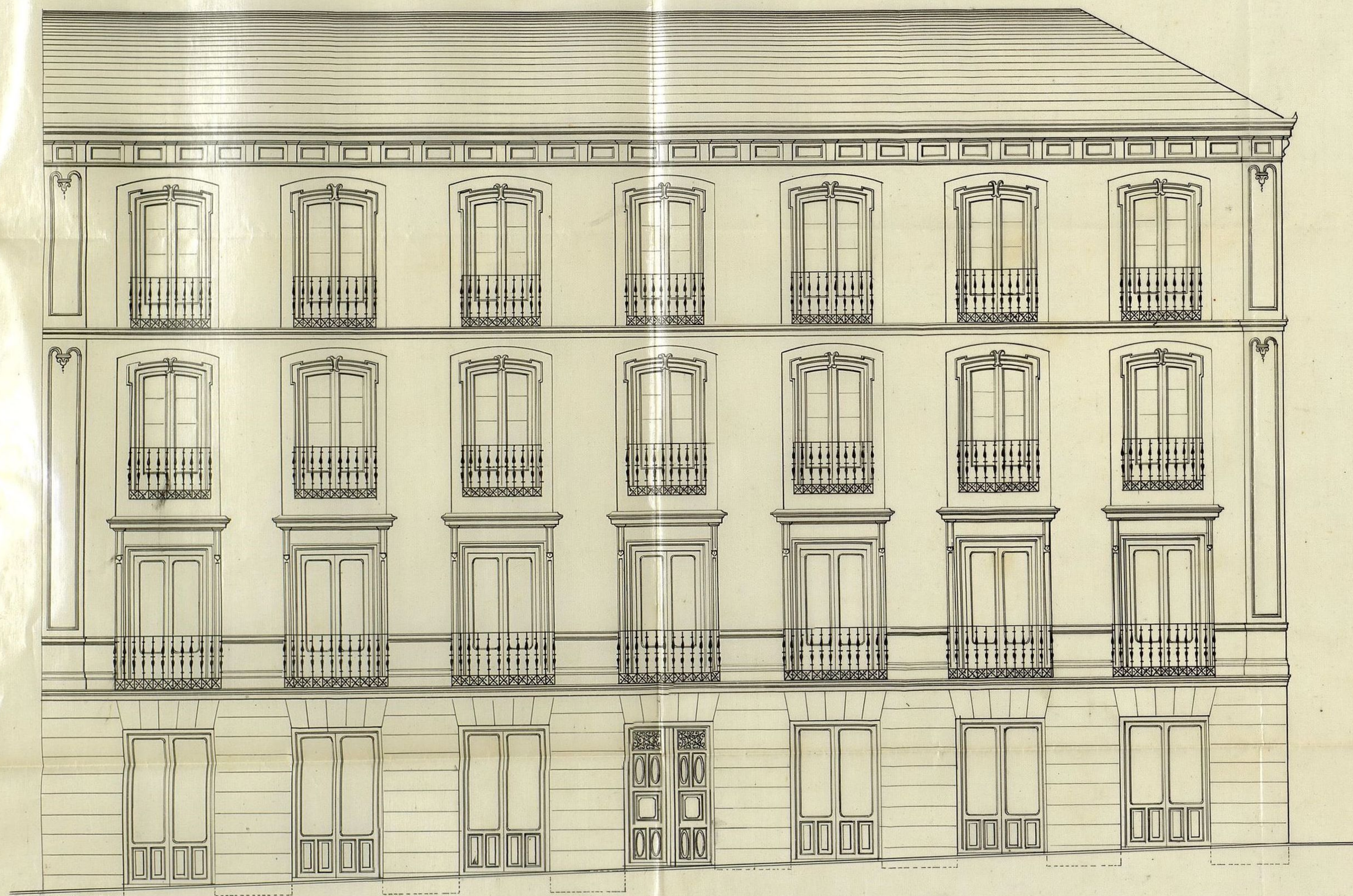
Calle del Clavel n.º 8 mod.º 7 antiguo manzana 300