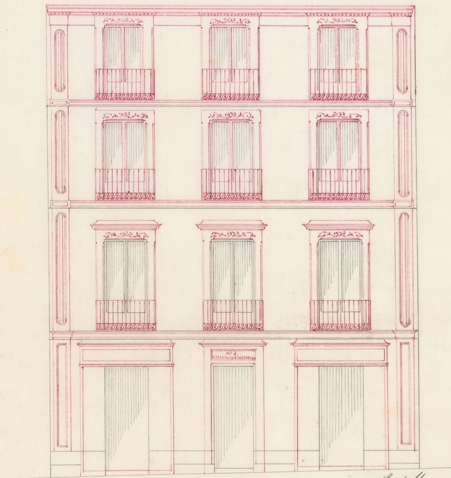
Proyecto de reforma