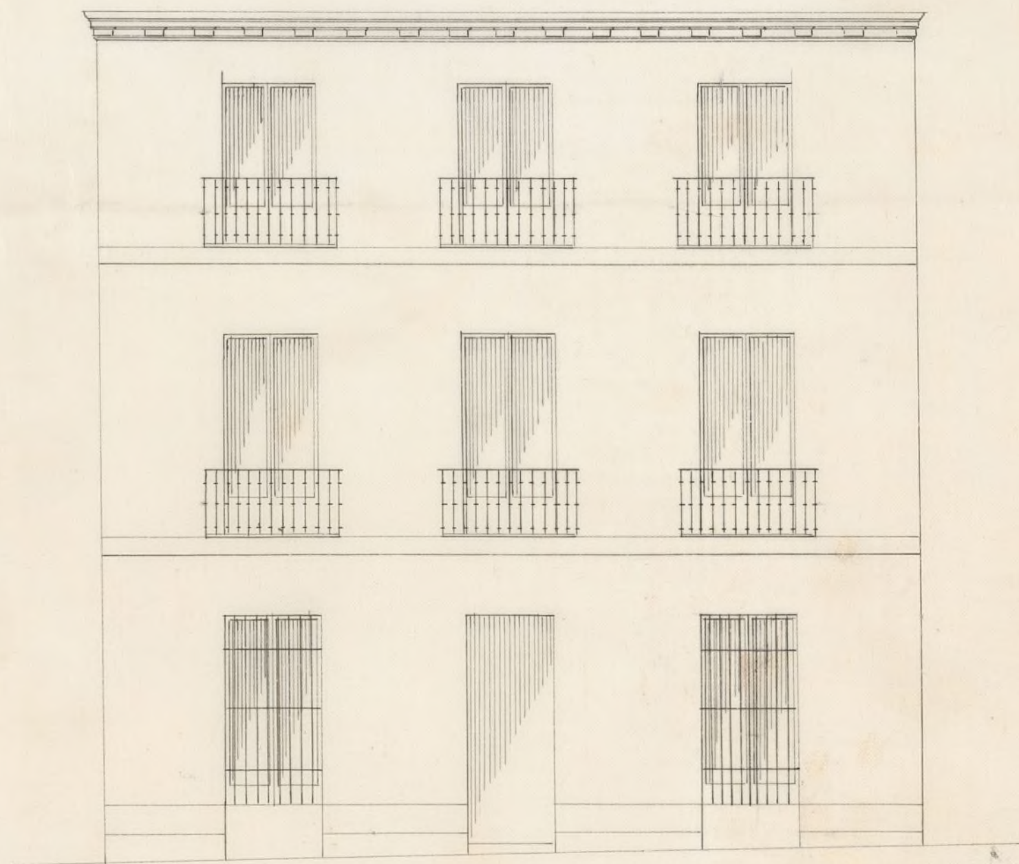
Fachada en estado actual