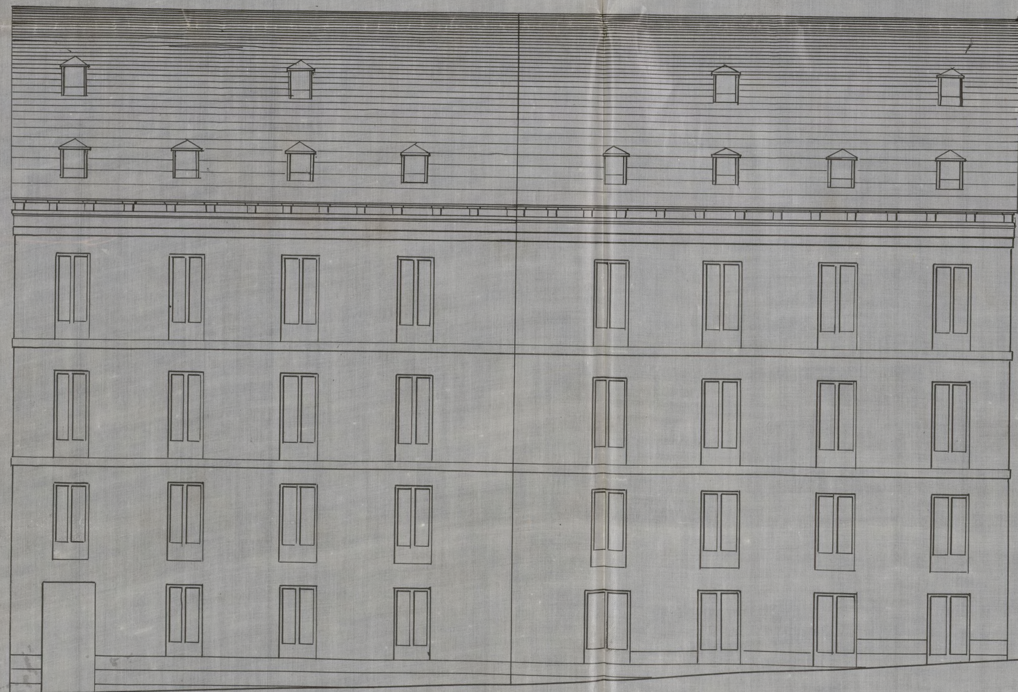
Plaza de las Cortes.