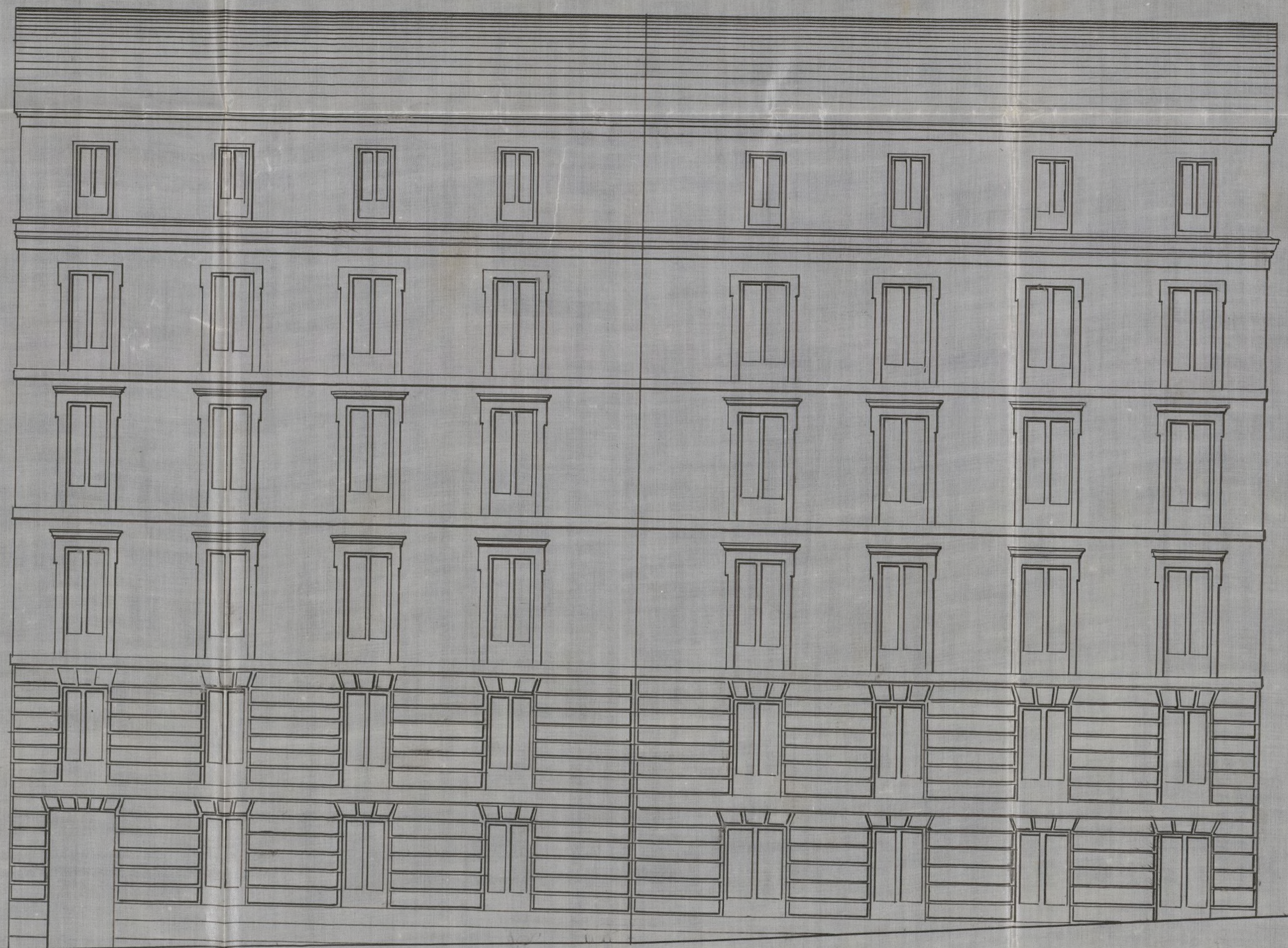
Plaza de las Cortes.