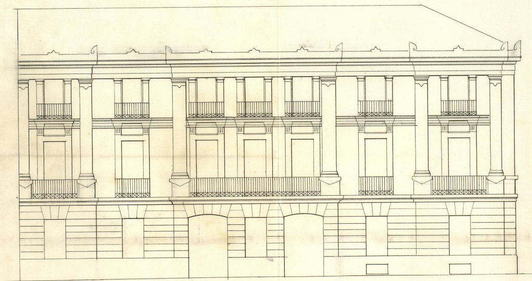
FACHADA A LA CALLE DE SERRANO.