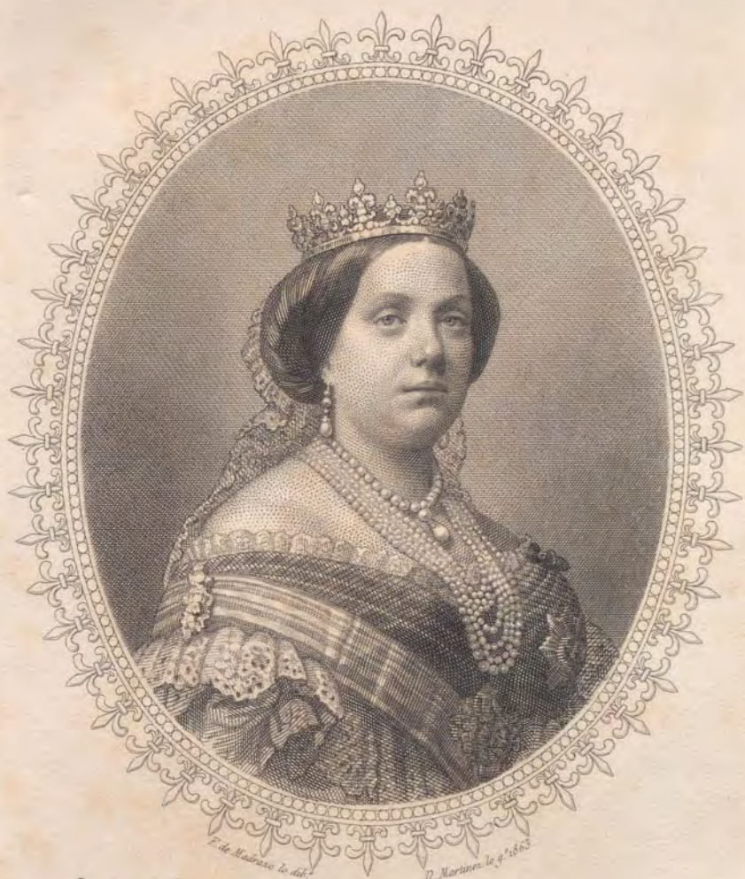
ISABEL SEGUNDA REINA DE LAS ESPAÑAS.