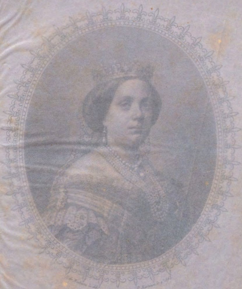
ISABEL SEGUNDA REINA DE LAS ESPAÑAS.