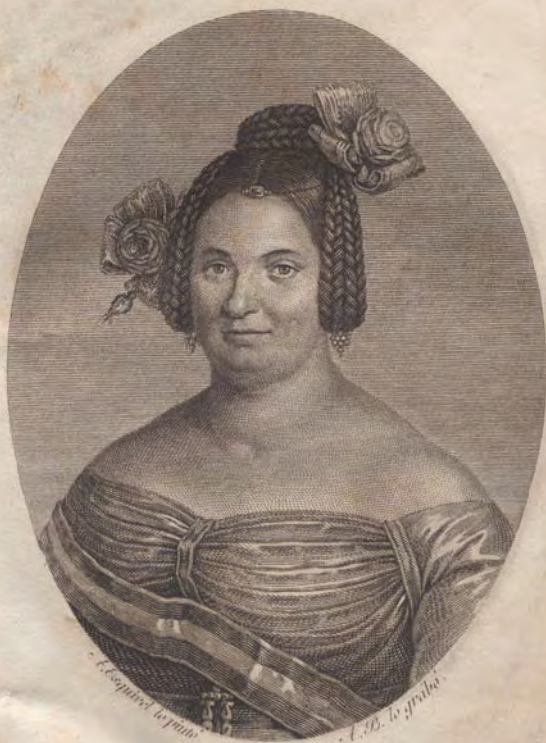
MARIA CRISTINA DE BORBON REINA GOBERNADORA, SU MADRE.