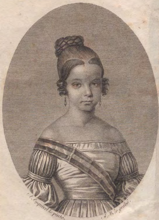
ISABEL II. DE BORBON REINA DE ESPAÑA.