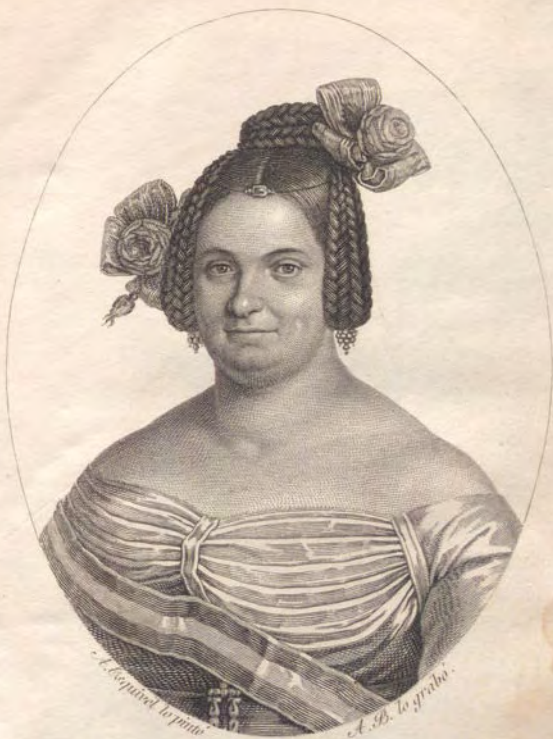
MARIA CRISTINA DE BORBON REINA GOBERNADORA, SU MADRE.