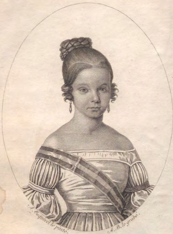
ISABEL II. DE BORBON REINA DE ESPAÑA.