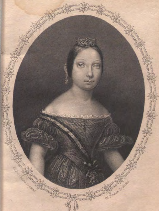
ISABEL II. DE BORBON. REINA DE ESPAÑA.