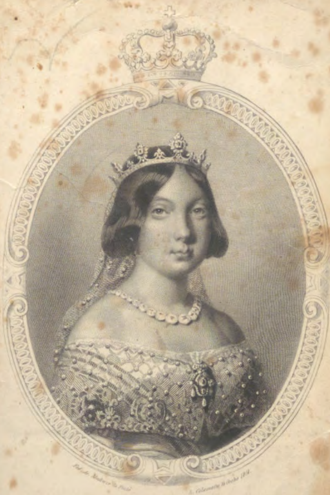
ISABEL SEGUNDA REINA DE LAS ESPAÑAS.