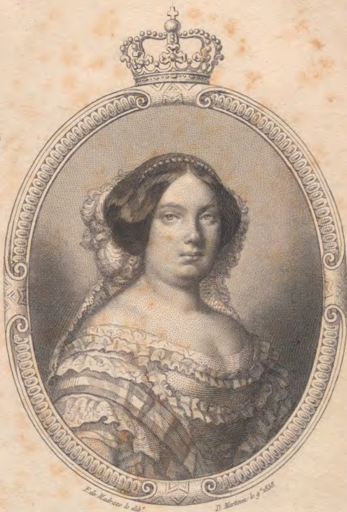
ISABEL SEGUNDA REINA DE LAS ESPAÑAS.