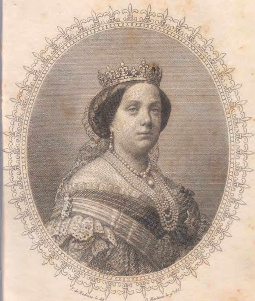
ISABEL SEGUNDA REINA DE LAS ESPAÑAS.