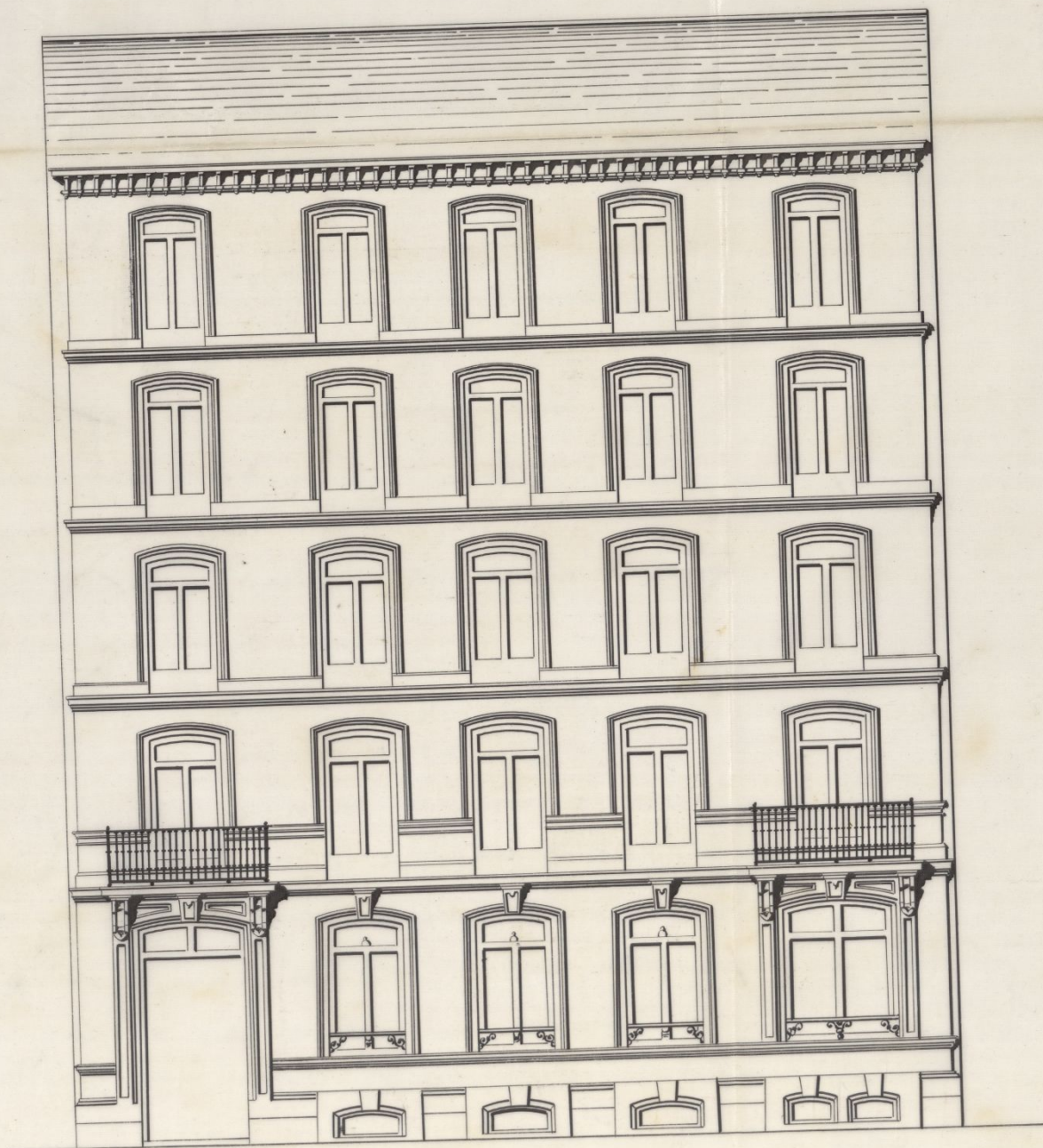
Calle de Piccolitos.