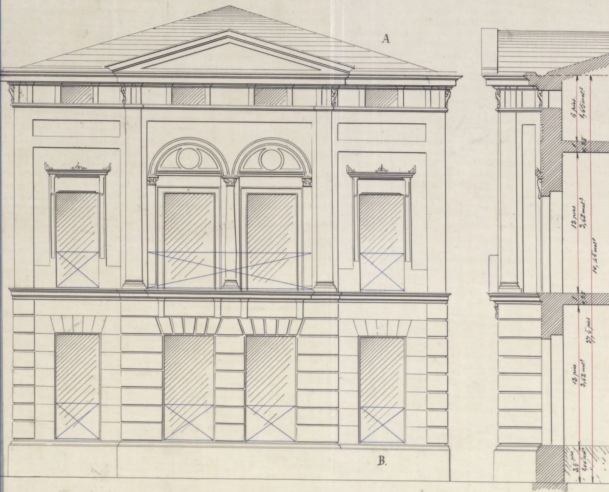
Fachada a la Calle de Fernandez de los Rios.