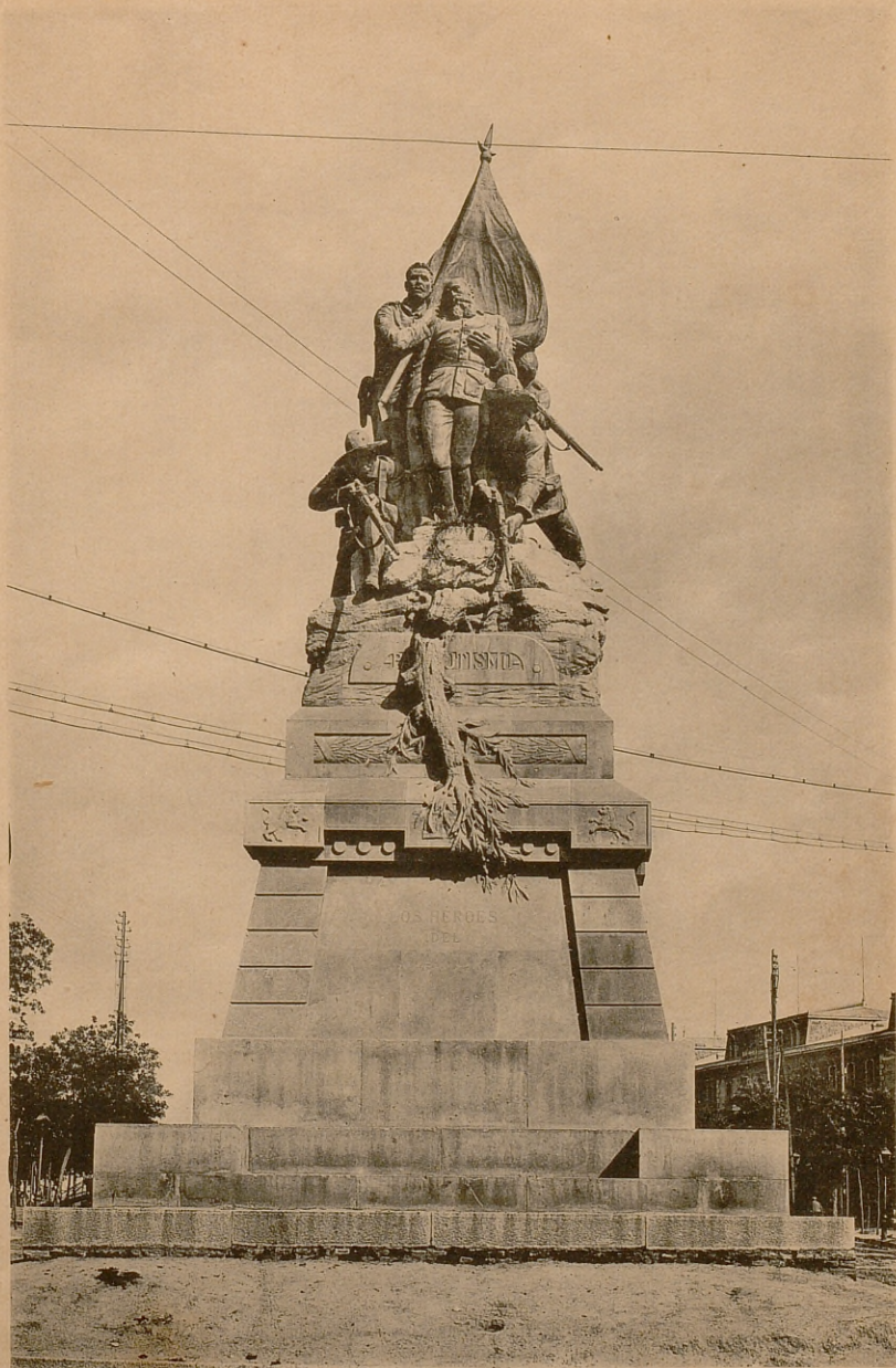
MONUMENTO Á LOS HÉROES DEL CANEY EN EL PASEO DE ATOCHA DE MADRID 1915