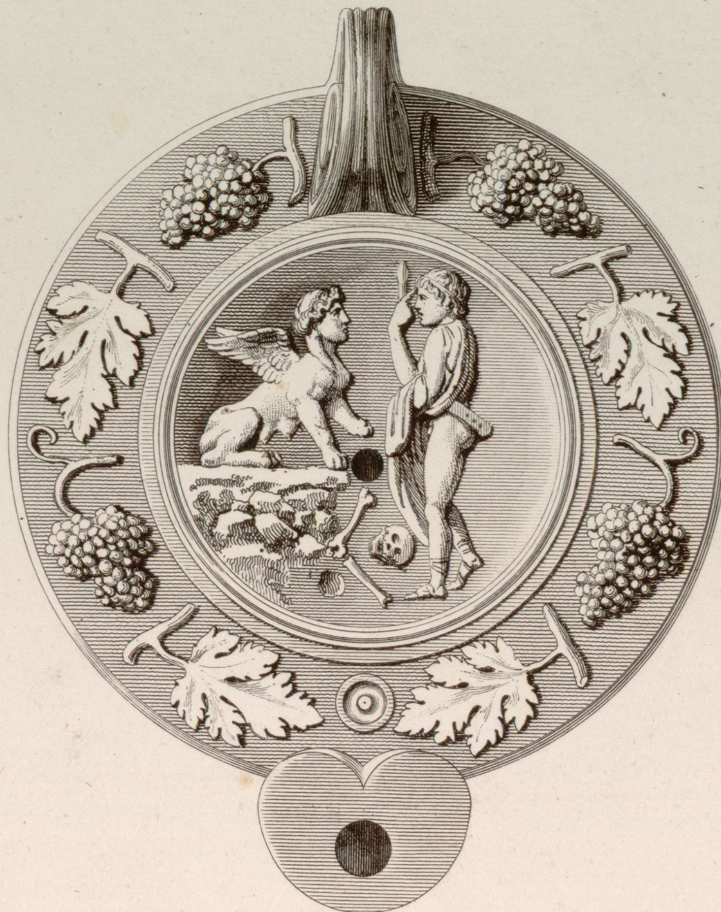
Antigüedades de Mataro y Olesa Ayuntamiento de Madrid