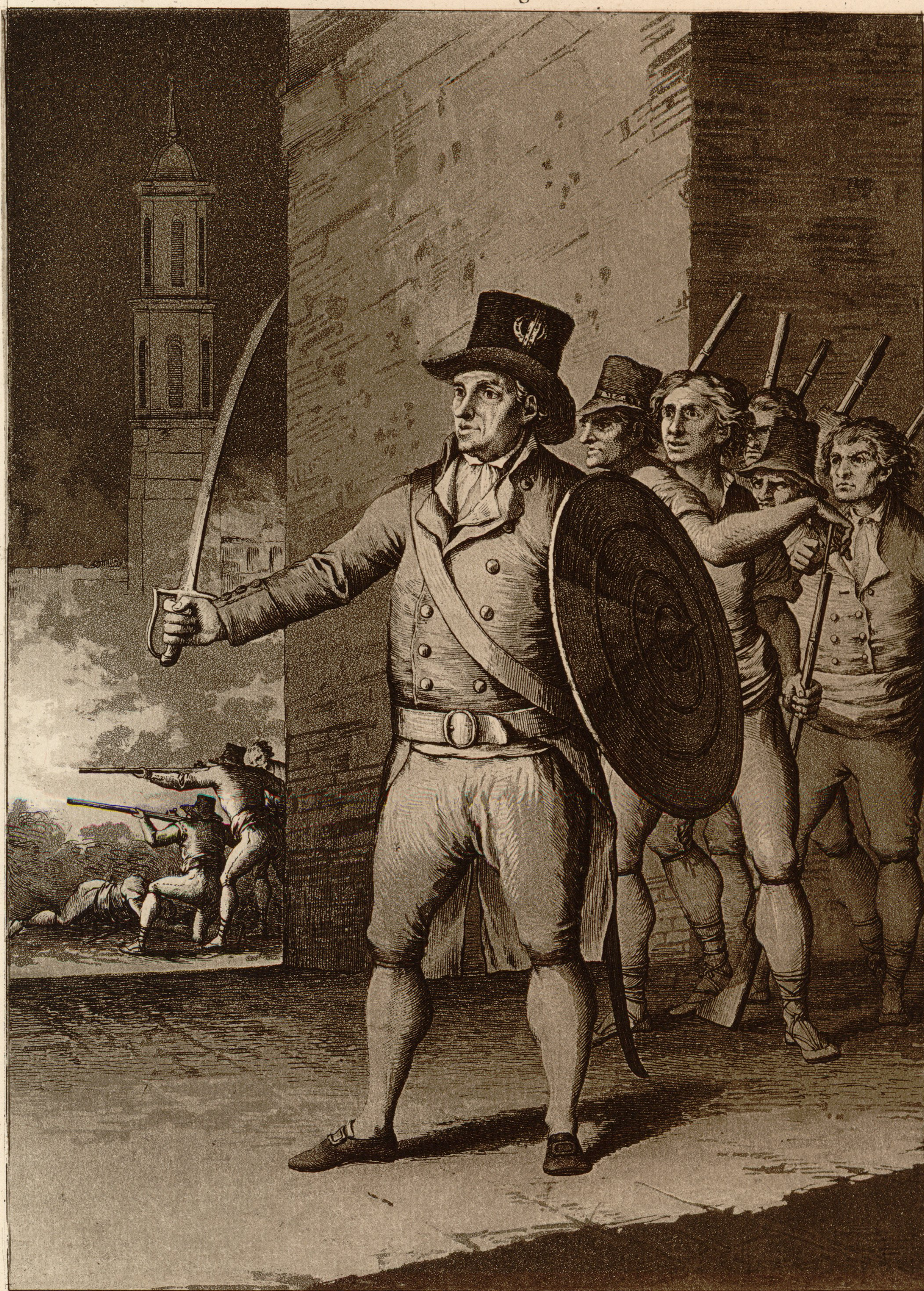
Ruinas de Zaragoza.

Labrador; natural de Zaragoza, y de la Parroquia de S. Pablo. Fue Capitan de una de las compañías populares del mismo barrio, y Gobernador del Castillo de la Aljafería; que defendió valientemente en el primer sitio de los muchos ataques que los enemigos le dieron. Quando estos penetraban en la Ciudad este valeroso Aragonés salia por las noches armado de su espada, y broquel haciendo prodigios de valor en las calles donde eran mas grandes el peligro y la refriega. Murió de edad de 65 años, a pocos dias de haber entrado los Franceses en Zaragoza, de resultas de las fatigas que sufrió en el 2.º sitio.