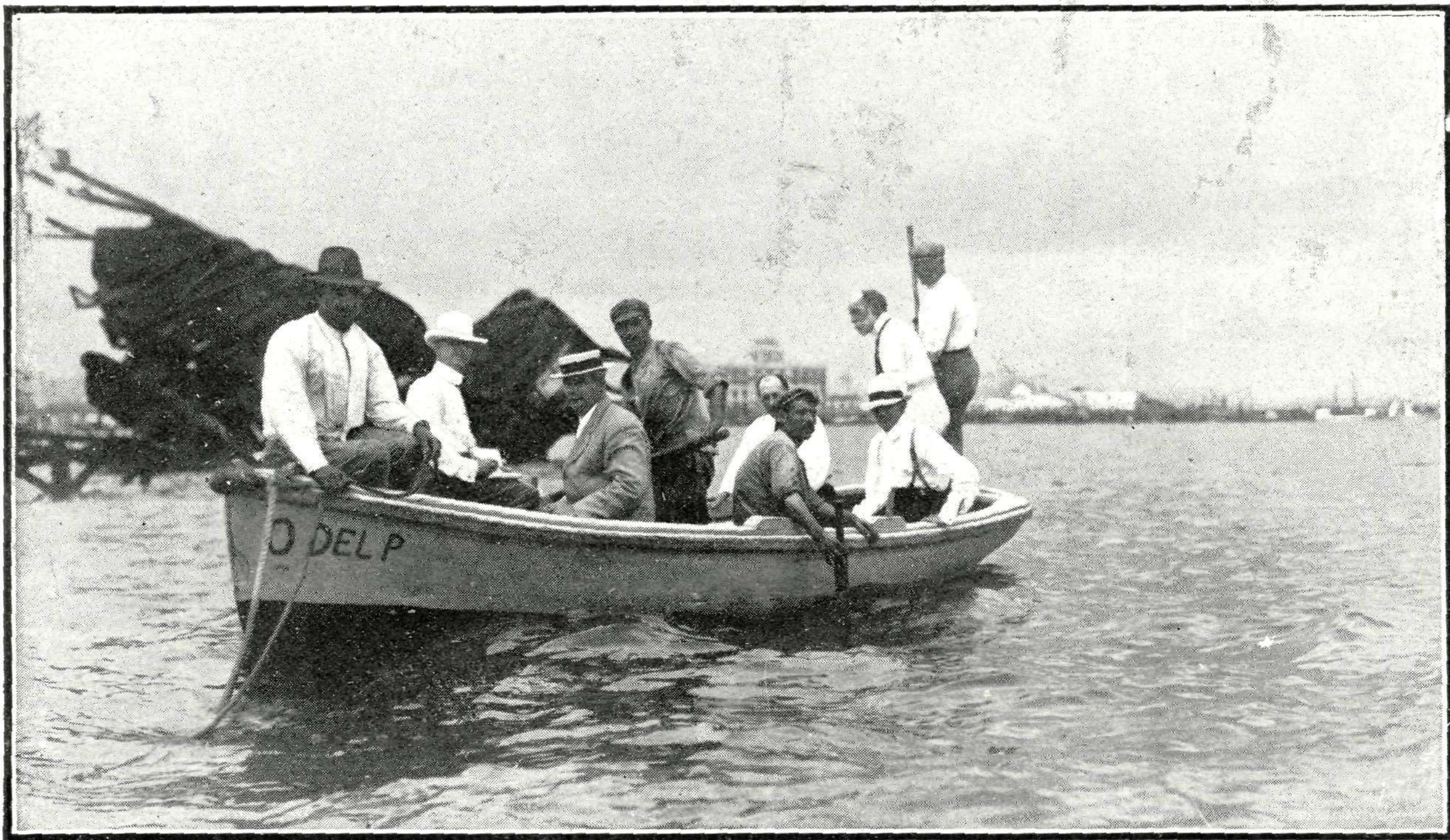
Comisión norteamericana que ha ido á la Habana á estudiar el medio de poner á flote el casco del "Maine", haciendo sondeos al rededor del buque

De la catástrofe ocurrida el 15 de Febrero de 1898 en la bahía de la Habana, que sumergió en el fondo de las aguas el acorazado "Maine" con pérdida de 270 vidas de sus tripulantes, quedan en la Historia las páginas de la guerra hispano-norteamericana que esta nación precipitó y sostuvo contra la nuestra creyéndonos causantes de aquella desgracia. Muchos intentos se han hecho por salvar el buque perdido y estudiar en su casco y en los restos que de él se conserven las causas ciertas determinantes de la explosión que produjo la catástrofe; pero hasta ahora ninguno de los proyectos estudiados se ha considerado factible. El actual Gobierno de Washington quiere ir decididamente á lo que bien podríamos llamar revisión de este proceso, y al efecto, se han presentado al presidente Taft varios planos para la extracción del "Maine", fundados, como puede verse en nuestro grabado de la página siguiente, en una complicada y pesada maquinaria que los españoles somos los primeros interesados en desear que respondan á los propósitos que sus ingenieros abrigan.