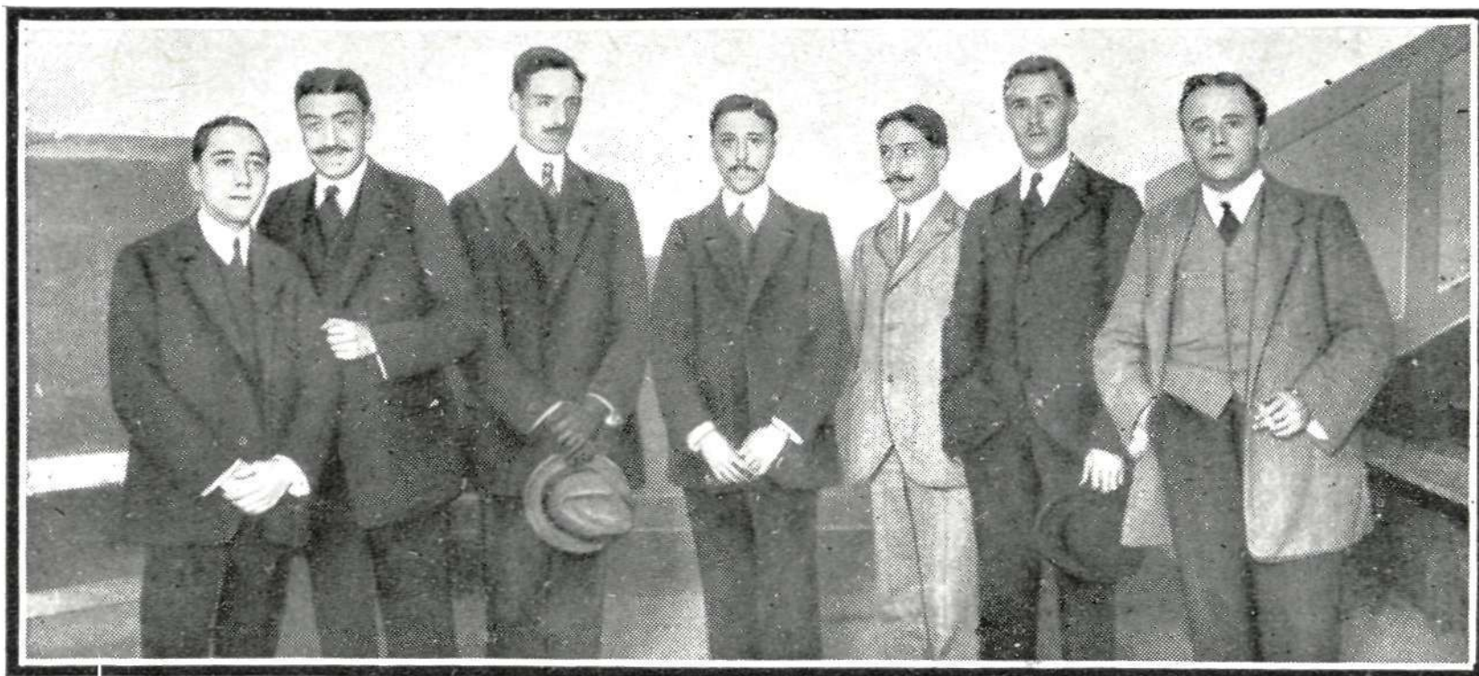
La comisión de estudiantes de Medicina encargada de solucionar el conflicto en nombre de sus compañeros