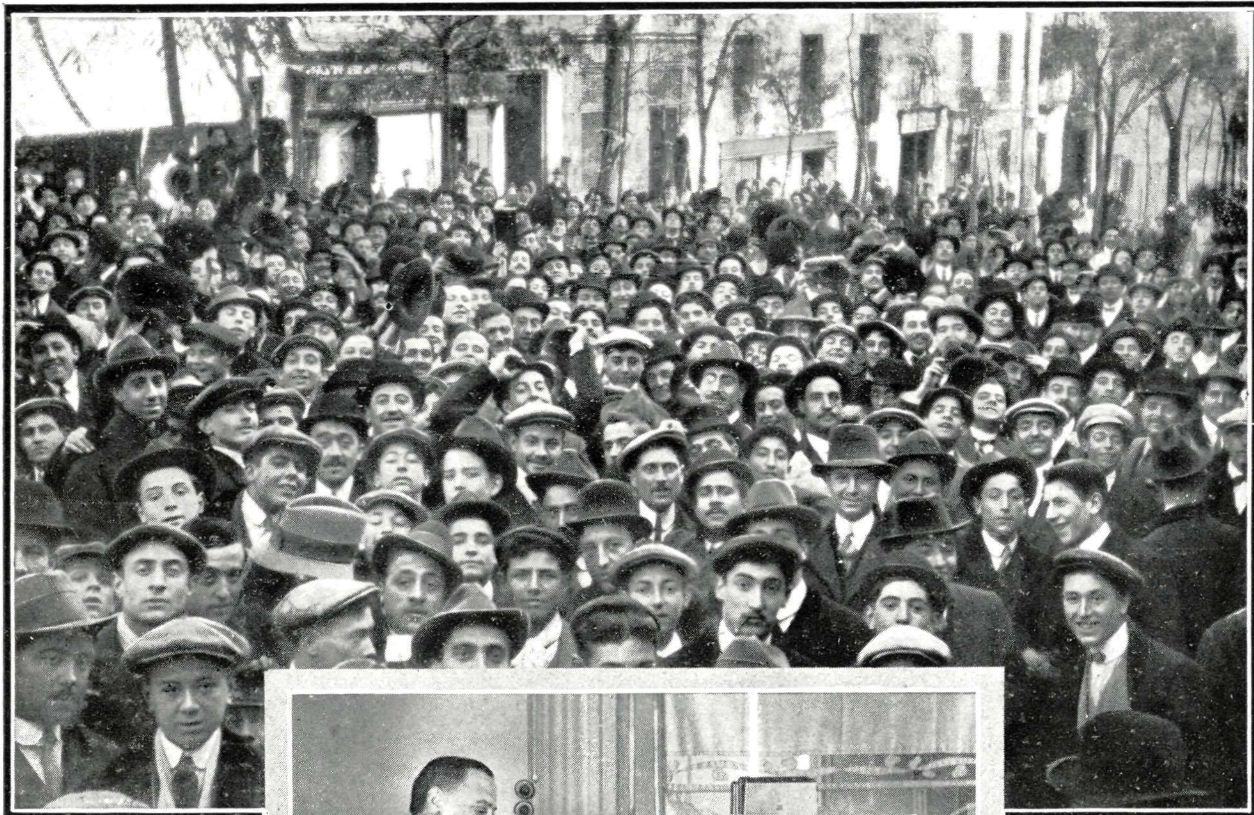
Manifestación de protesta realizada por los estudiantes de Medicina