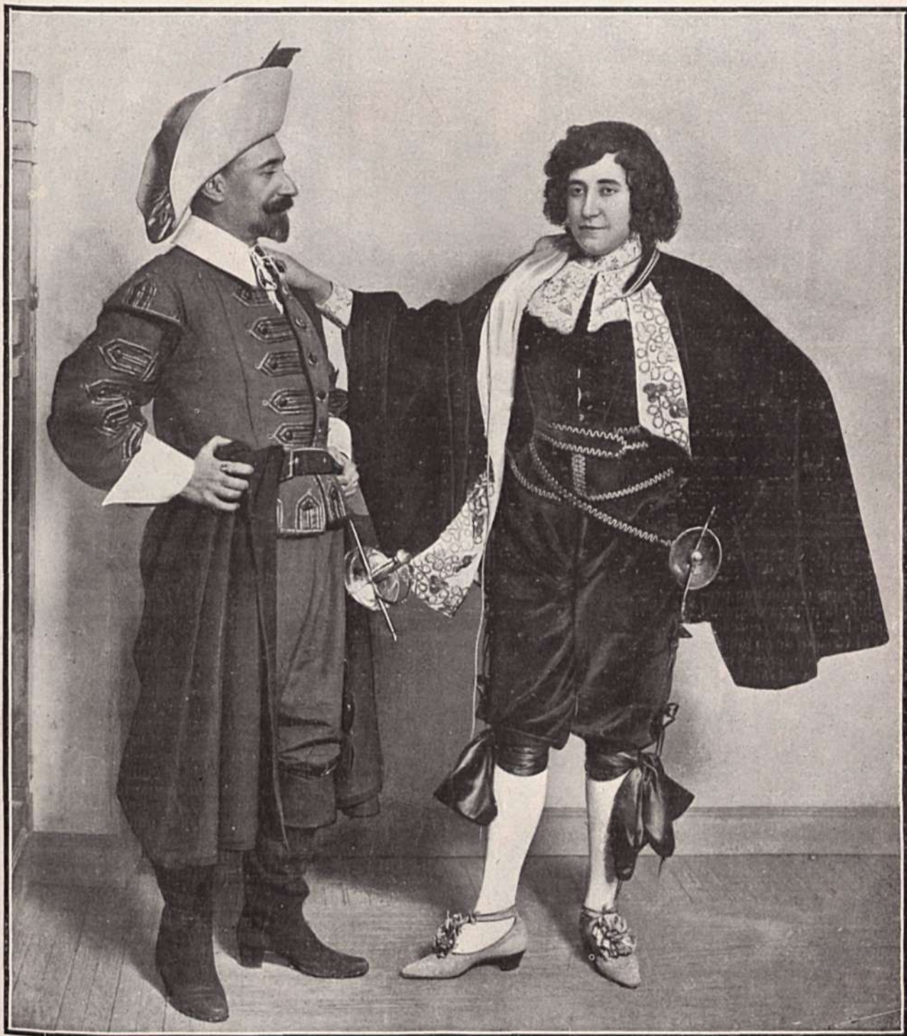
Jacinto Benavente, el ilustre autor de "Los intereses creados", representando el papel de "Crispín" de su magnífica comedia en el Teatro Lara, de Madrid, el día 28 de Diciembre ultimo