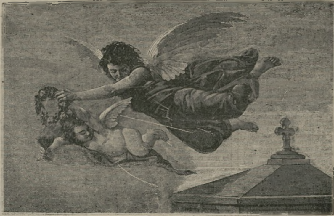
La vida eterna.

contrar uno tras otro. ¿Que nada dejan de bueno? ¡Con tal que no dejen de malo!... Pues si así dejan de malo. Allí lo veremos; y si acaso por un gustazo, un trancazo, representaremos el sainete de Los paños deseados ; y sobre todo, cuando lleguen los tiempos de las impotencias y los arrepentimientos, estaremos en el caso de echarnos las de diablo predicador. Tal es la teoría general del placer en este mundo positivo: bien está que aconseje la prudente y racional elección de los placeres; pero no espere que se os haga caso, porque las teorías mientras más verdaderas más impertinentes, y mientras más bellas más divertidas.