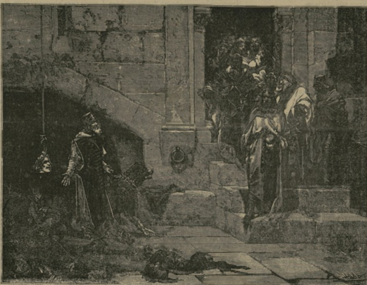
La campana de Huesca.

Durante el año último se han abierto a la explotación en la República Argentina, nada menos que 1.208 millas de vías férreas (cerca de 2.000 kilómetros), de las cuales 382 millas son de ferrocarriles garantizados por el gobierno. Las Compañías ferrocarrileras han sometido además al gobierno 472 planos que fueron debidamente examinados y aprobados por el inspector general, firmándose contratos para los ferrocarriles que apuntamos a continuación: 1) de Carlot a Rio Cuarto; 2) de Rosario a Lincoln, Pigué y General Acha; 3) de Paraná a Monte Caseros; 4) de Tinogasta a Chile; 5) de Plaza Constitución a Arroyo Morales; 6) de Junín a Bolivia; 7) de Zárate a la Boca; 8) de Campanas a Pilar; y 9) de Chicleto a Famatina. Respecto a los ferrocarriles garantizados de la República, se dice que el Estado ha pagado, hasta la fecha, más de 18.000.000 pesos en oro, en cumplimiento de sus obligaciones de garantía.