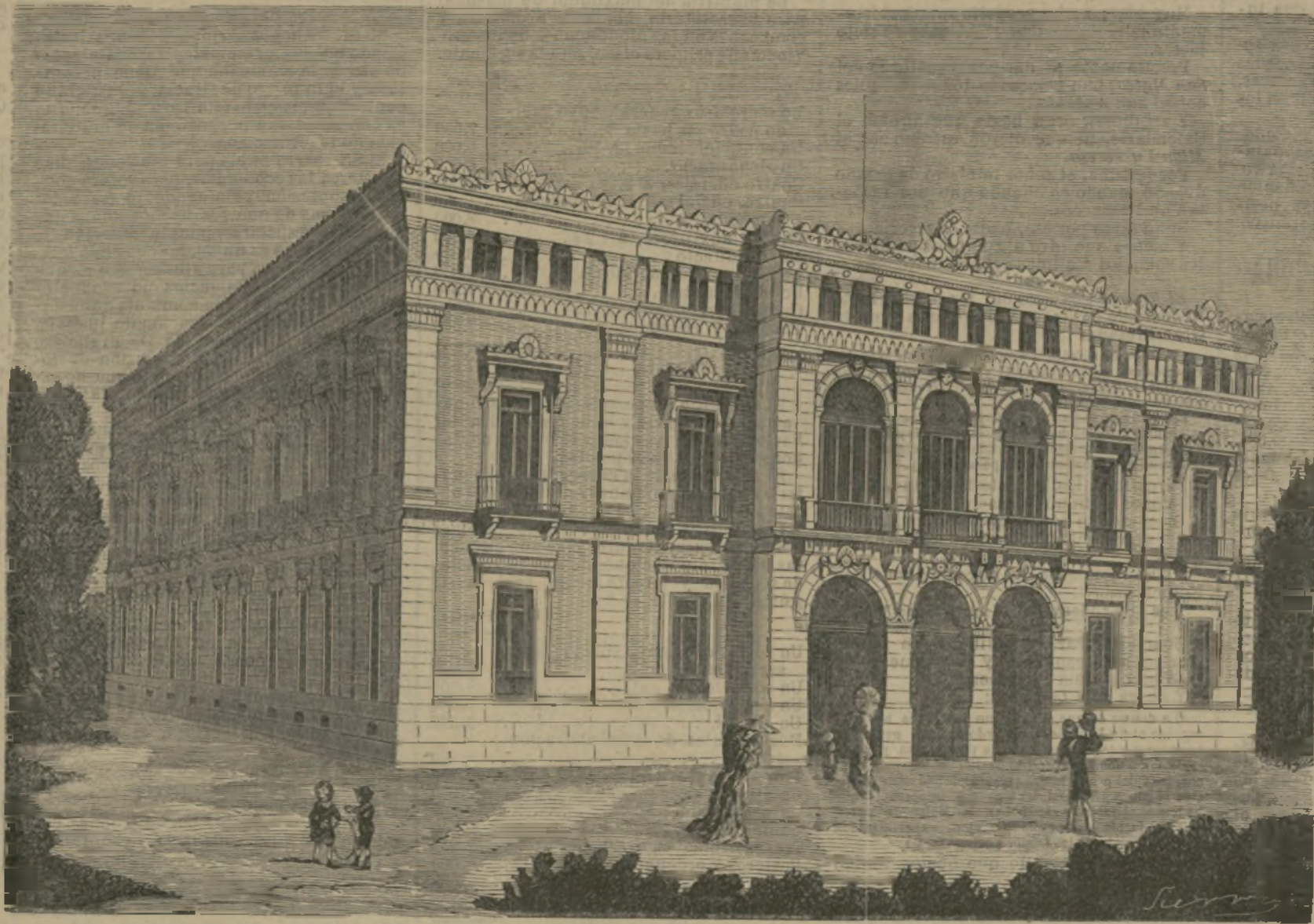
Palacio de Anglada.