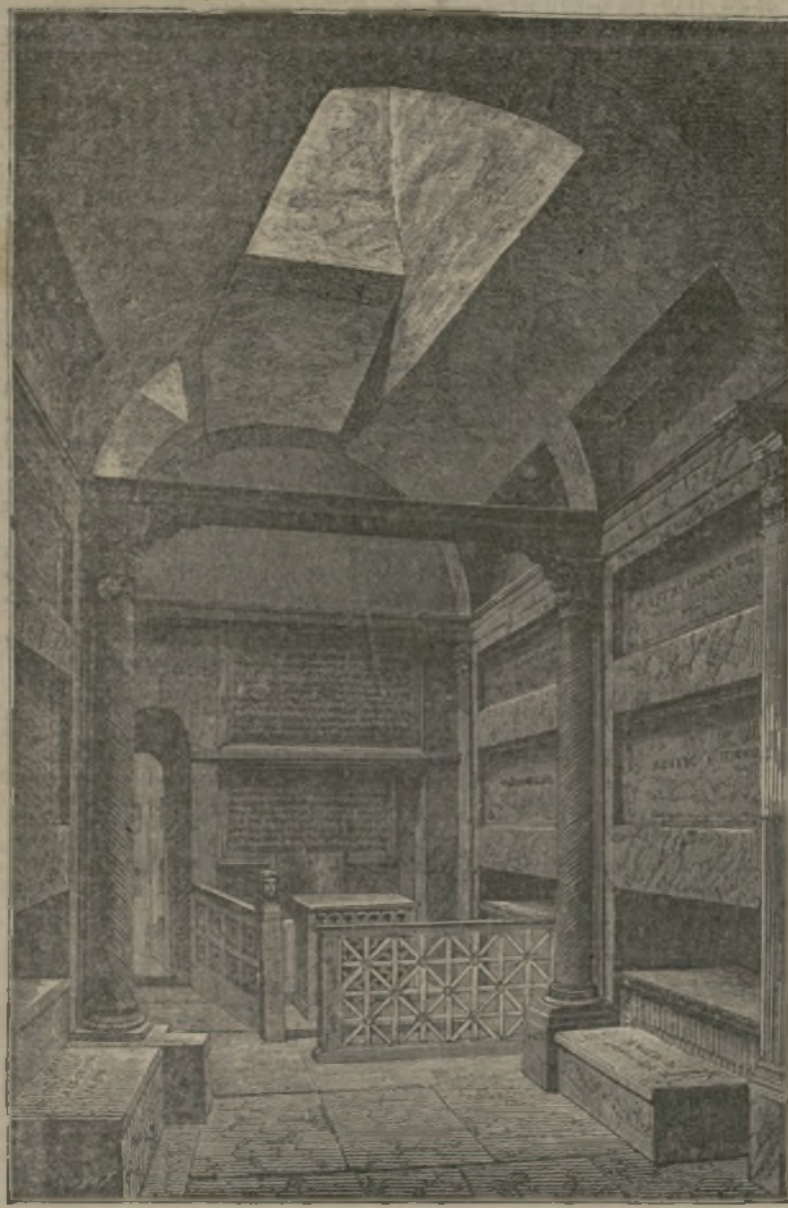
Cripta de San Calixto.

SE SUSCRIBEN En las oficinas de El Globo, Edm. Aguirre, 2, y en todas las librerías. ANUNCIOS En las oficinas de El Globo, Edm. Aguirre, 2, y en todas las librerías. REMITIDOS Precios convencionales. Toda la correspondencia se dirigirá al Administrador de El Globo.