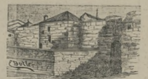
Muralla y pórtico de la casa de doña Urraca.

La capilla mayor, reedificada en los últimos años del siglo XV, se distingue por su pronunciado estilo gótico, por sus agudas ojivas y por la crucería y aristas doradas de sus bóvedas; entonces se decoraron también interiormente las puertas del primitivo crucero, la una con calados colgajos de grifos y candelabros, la otra con hojas de cardo y de pámpanos muy delicadas; pero el retablo, como vaciado en el molde de Ventura Rodríguez, arquitecto del siglo XVIII, no se aviene con el gusto de la capilla, por más que brillan en el columnas de rosado jaspe con capiteles dorados y el medallón principal representando en mármol de Carrara, la transfiguración del Señor.