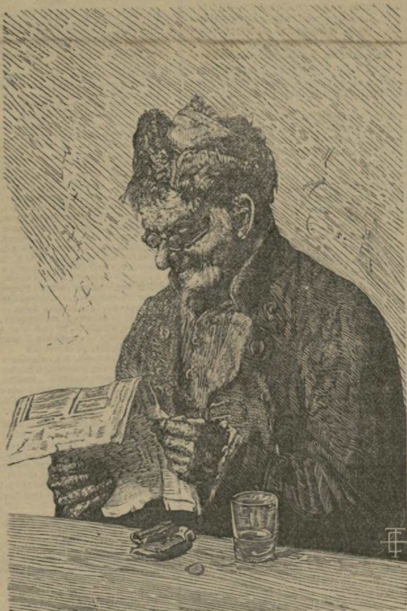
¡Pronto se armará!

Precios convencionales. Toda la correspondencia se dirigirá al ADMINISTRADOR DE EL GLOBO