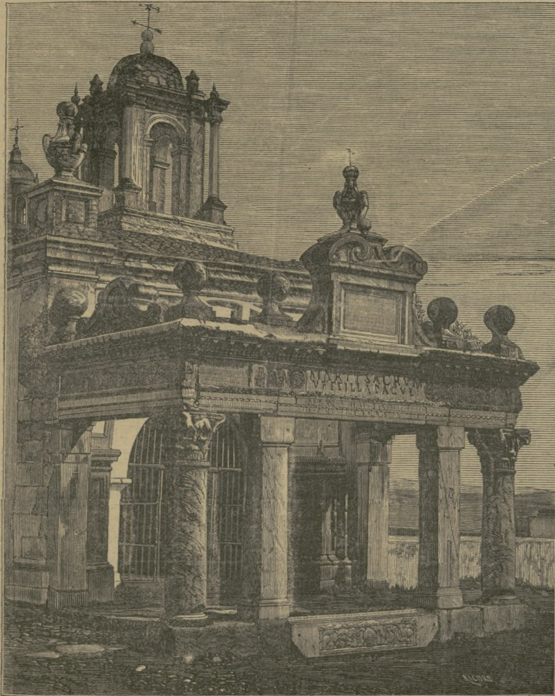
Hornillo de Santa Eulalia.

Si fuéramos á citar solamente los nombres de los esclarecidos ingenios que han