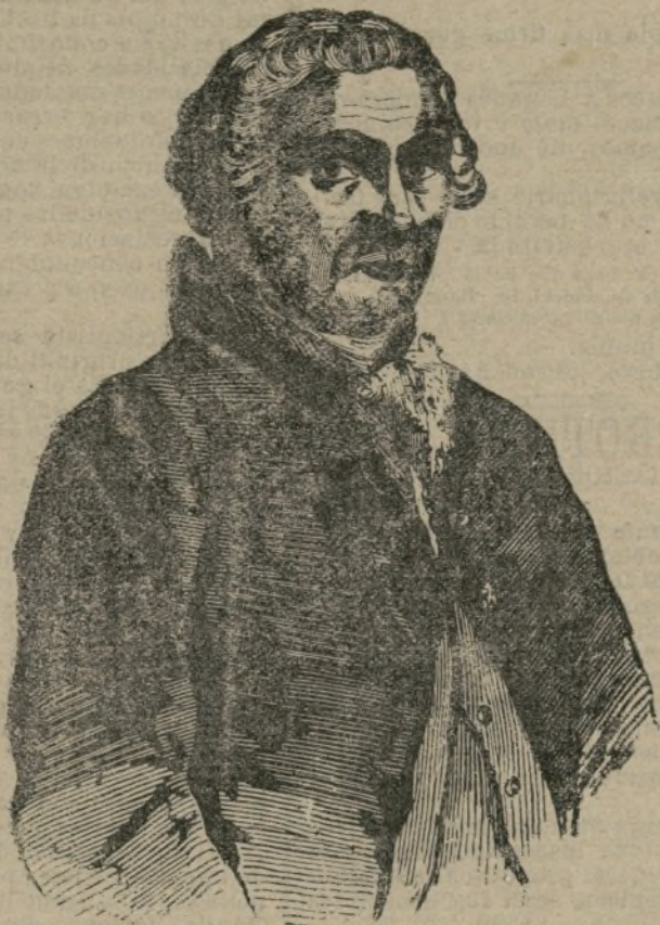
El barón de Riperdá.

Hasta aquella época, la naturaleza no había creado en nuestro antiguo globo más que algunos seres innobles, ciegos y mudos, pero en su anhelante progreso llegó a producir el trilobito cuyo ojo abierto a luz del día fué perfeccionándose en el lento caminar de los siglos, hasta convertirse en el ojo penetrante del águila.