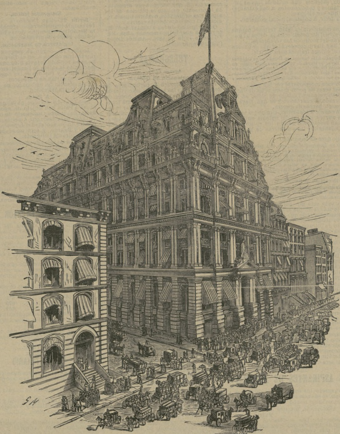
El palacio de la Equitativa, en Nueva-York.

Los gastos de instalación en el domici- lio de los clientes son de 20 a 25 pesetas por lámpara, y además el precio de éstas.