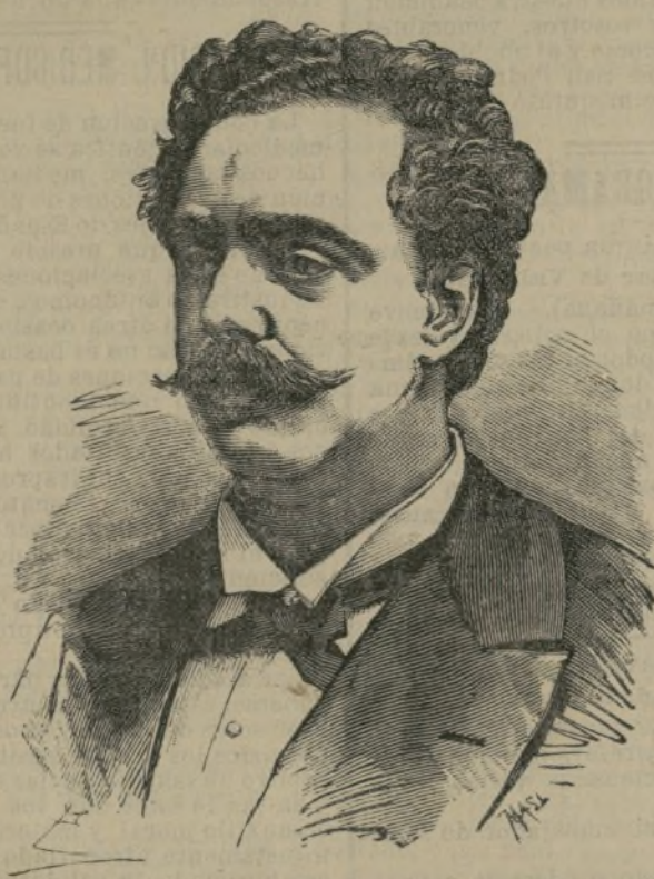
Edmundo de Amicis.

En sus viajes, Amicis ha trabado amis- tad con las personas más notables de Eu- ropa, y de esto ha tomado motivo para es- cribir estudios literarios de mano maes- tra, en que las figuras de Víctor Hugo, de Zola y de nuestro eximio Castelar se ha- llan admirablemente pintadas. Aunque en sus libros no ha demostrado Amicis determinadas tendencias de es- cuela, en sus últimos tiempos se ha decla- rado socialista, tendencia que puede ex- plicarse por la simpatía que siempre ha demostrado hacia las clases bajas de pro- tección y de independencia. La pluma de Amicis es, en suma, una de las más brillantes y galanas que ha producido nuestro fecundo siglo, y su memoria pasará a los venideros, rodeada del glorioso nimbo que distingue a los genios.