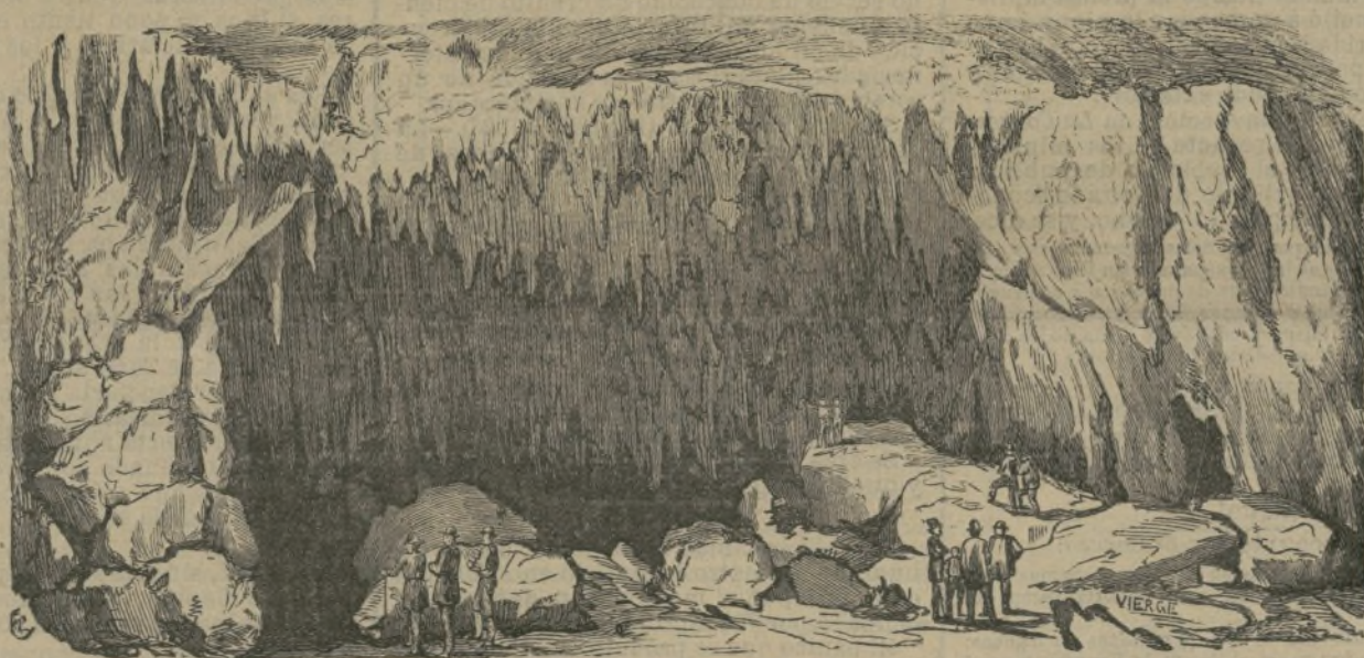
La gruta de Antiparos.

Es la mejor recomendación que podemos hacer a nuestros lectores.