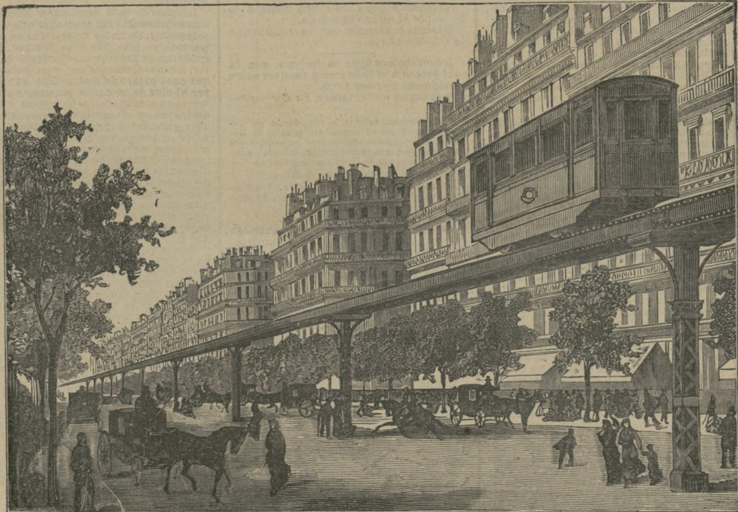
Camino de hierro eléctrico.

Infensivos con todos y muy cariñosos con los extranjeros, tienen costumbres simplicísimas y bastante puras, dada su ilus- tración.