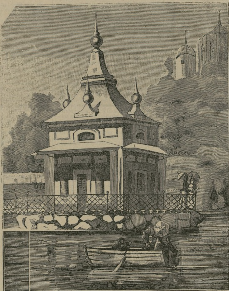
Casa del Pescador en el Retiro.

Otras particularidades que llaman la atención es que no vegeta en los lugares donde existen gases extraños al de la composición del aire puro, humos, etcétera; etc.; por esta pureza podría juzgarse a golpe seguro de la pureza del ambiente; y tanto es así, que jamás se encuentra en las ciudades y en las grandes aglomeraciones, en donde la atmósfera está cargada de polvo y de otras impurezas.