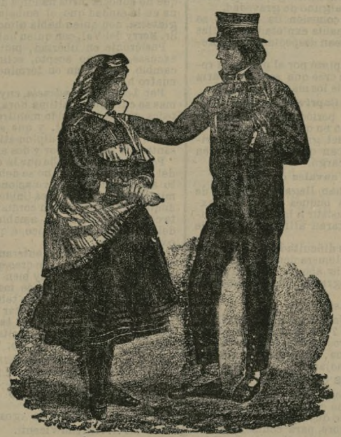
Tipos de Silesia.

La gran provincia prusiana de Silesia, situada entre la Polonia rusa, la Galicia, la Moravia y la Bohemia austriaca, ofrece todavía tipos legendarios en algunas de sus comarcas, cuyos vestidos y costumbres recuerdan los de tiempos bien remotos. Ejemplo de ello, es el grabado que hoy ofrecemos a nuestros lectores, habitantes de la cuenca del Sprée, cuyos vestidos no pueden ser más típicos. La misma tradición de los trajes, revis-ten sus costumbres y gustos. Así no debe extrañar la sencillez de su vida ordinaria, así como lo ceremonioso de sus actos más espléndidos. Esas buenas gentes, dedicadas por lo común a las faenas agrícolas, recuerdan al tipo alsaciano, con el cual tienen de contacto hasta su gran afición a la cer-veza. Pacientes y sumisos, de disciplina ver-daderamente exagerada, tienen un culto por la casa de Brandeburgo, que sobrepu-ja al que puedan profesarle los prusianos más dinásticos. Así ocurre, que cuando los emperadores de Alemania, reyes de Prusia, duques de Brandeburgo, recorren aquellas hospita-