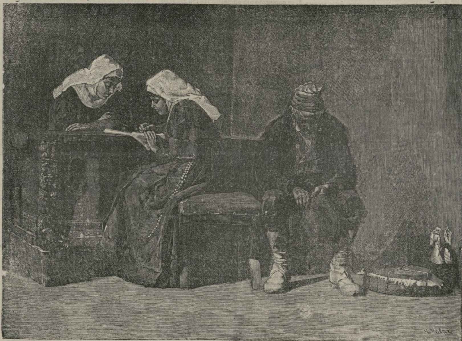
Para el señor Cura.

Del peso atómico 9,1 y del peso específico 2, deduce un físico en el Electrical World , valiéndose del cálculo, que la resistencia del glucinio a la atracción es mayor que la del hierro, y su conductibilidad poco más ó menos la de la plata. Dicho metal debería ser, pues, más resistente mecánicamente que el hierro; mejor conductor que el cobre, y además más ligero que el aluminio, cuyo peso específico es 2,7. Si la experiencia confirma estos datos, es indudable que el glucinio se empleará dentro de poco en la electricidad, tanto más en cuanto su valor corriente sería de unos 200 francos el kilogramo, lo que viene a ser 80 veces menos caro que el mismo volumen de platino y 5 veces menos caro que el propio peso de este último metal.