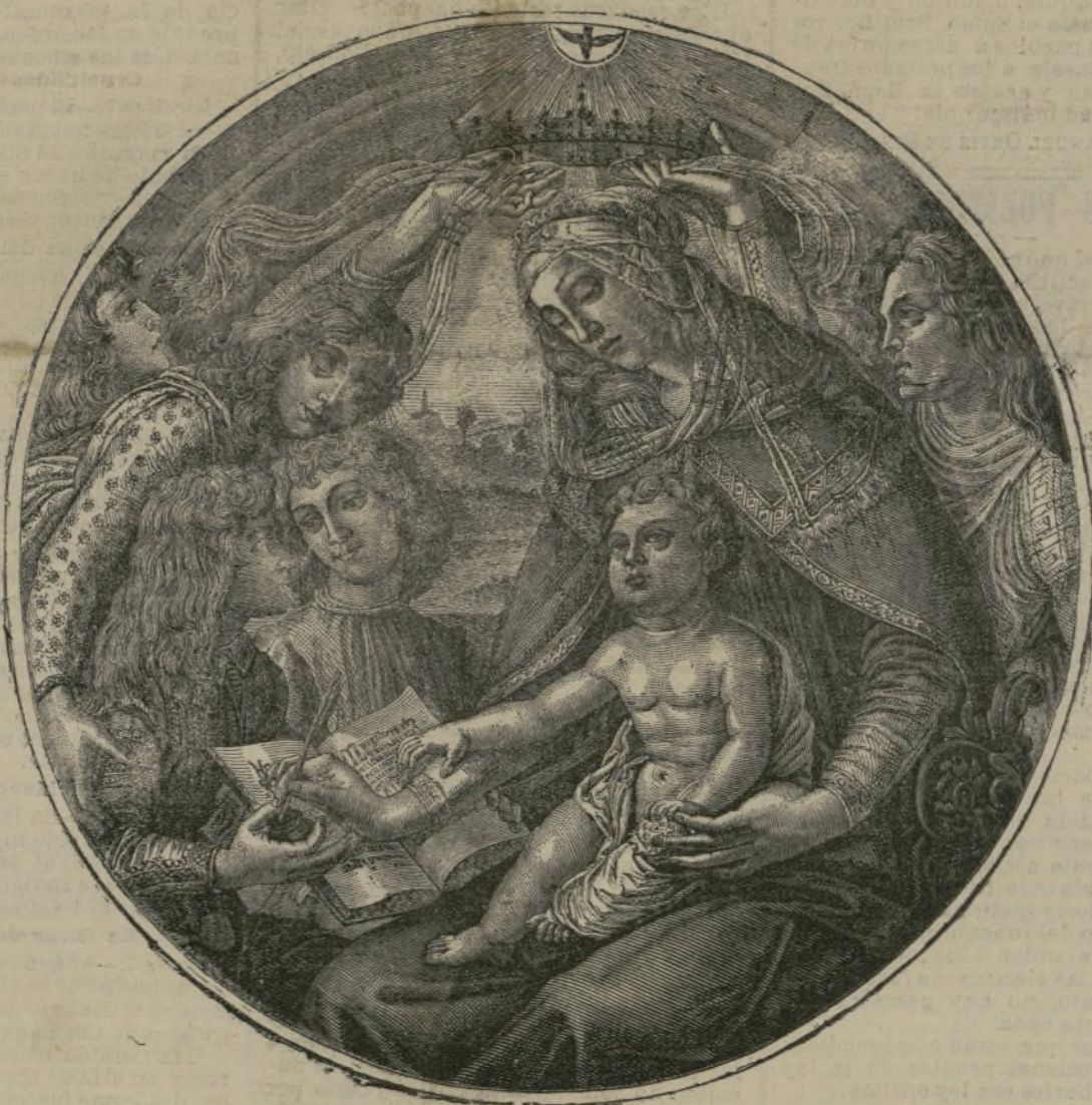
La coronación de la Virgen.

Esta diferencia de 43 por 1.000 en la mortalidad de los niños de poca edad, debería hacer comprender á los legisladores que el puesto de la mujer está en el hogar doméstico.