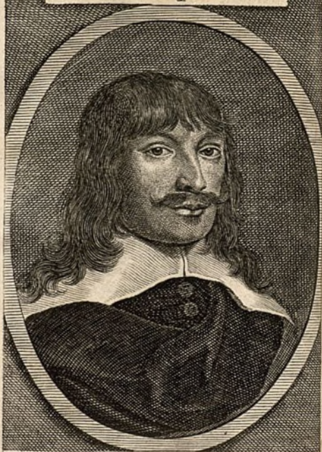
MARCVS ZVERIVS BOXHORNIVS, Bergopzomanus, Eloquentiae in Acad. Leidensi Professor,