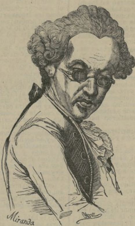
D. José Antonio Conde.

El ilustre personaje cuyo retrato publicamos hoy, fué un notable orientalista y un historiador distinguido que hizo progresar sensiblemente los estudios árabes en nuestra patria y conquistó desde los primeros años de su juventud la merecida fama á que su talento le hacía acreedor. Sobresalió en el profundo conocimiento de varios idiomas, merced al cual pudo practicar importantes investigaciones que se encuentran brillantemente expuestas en las obras que brotaron de su pluma durante la segunda mitad de su vida.