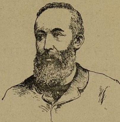
ÚLTIMO RETRATO DEL MAESTRO HERMANN LEVI